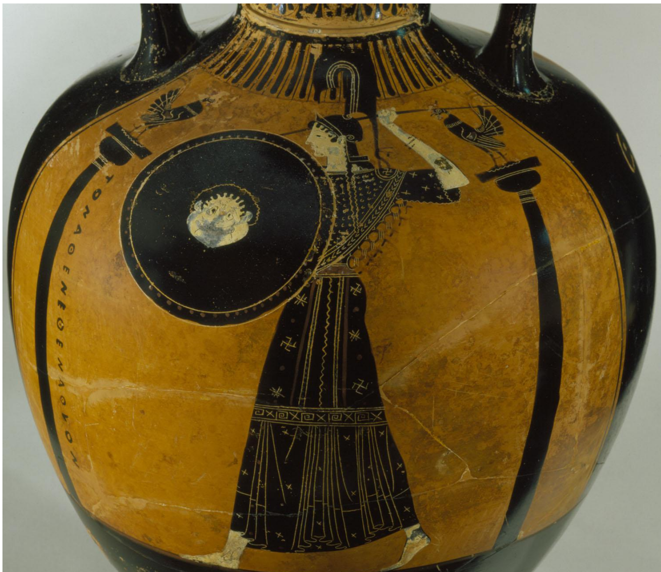
Панафинейская амфора. Аверс. 323 - 322 г. до н. э.