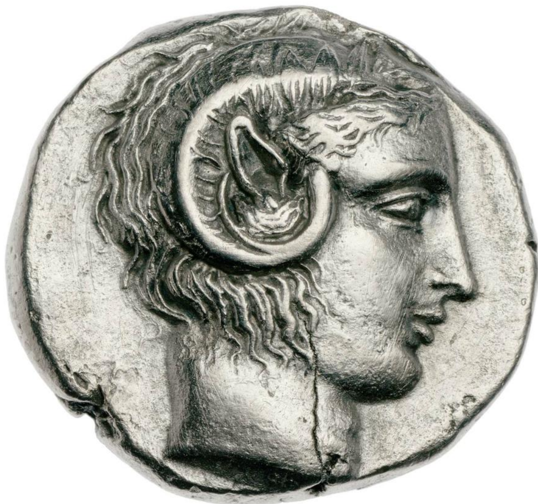
Метапонтийский статерс изображением головы Аполлона Карнейского. Аверс. Греция. 430–410 гг. до н. э.