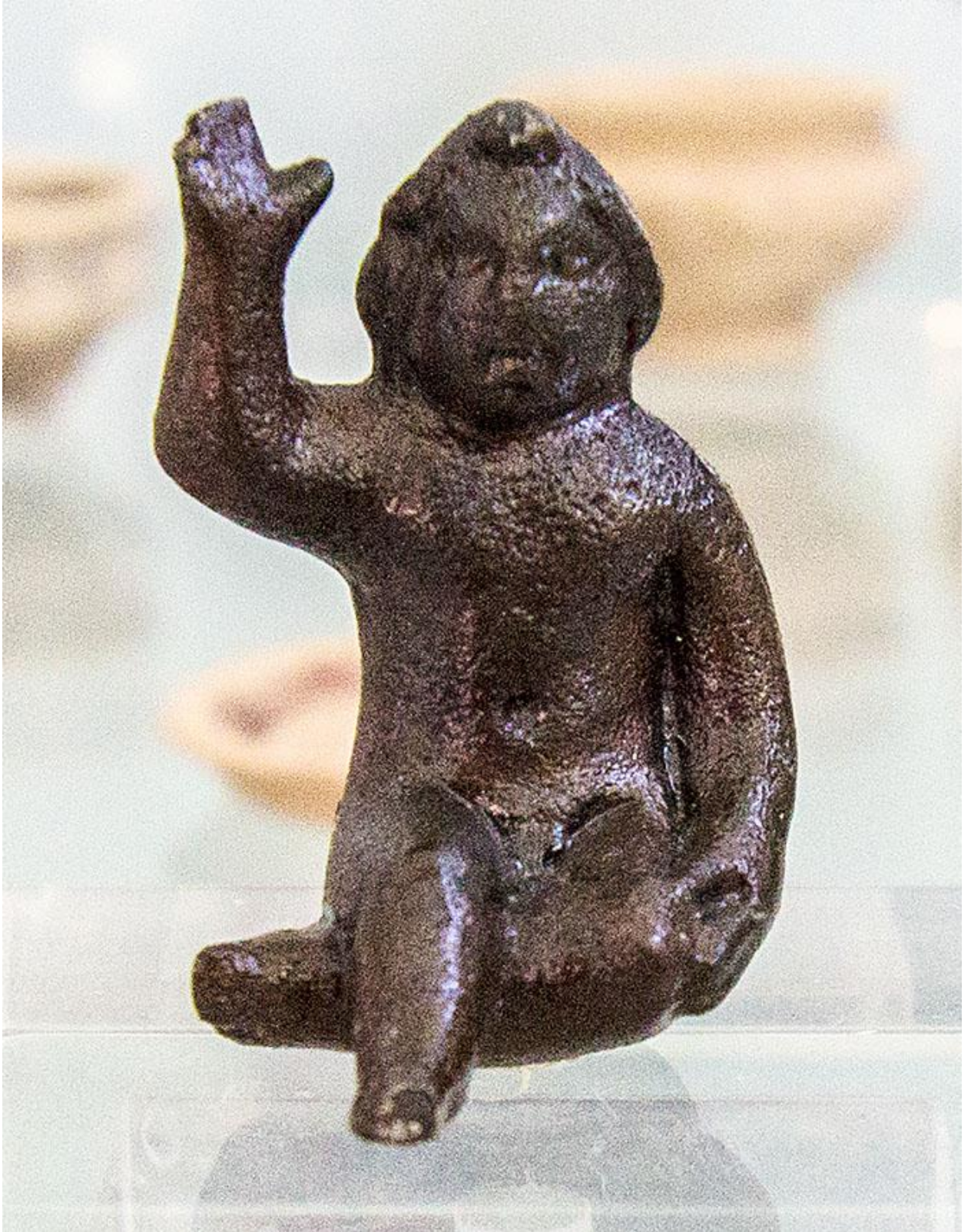
Бронзовая статуэтка Офельта. 300 г. до н. э. Археологический музей Неми.