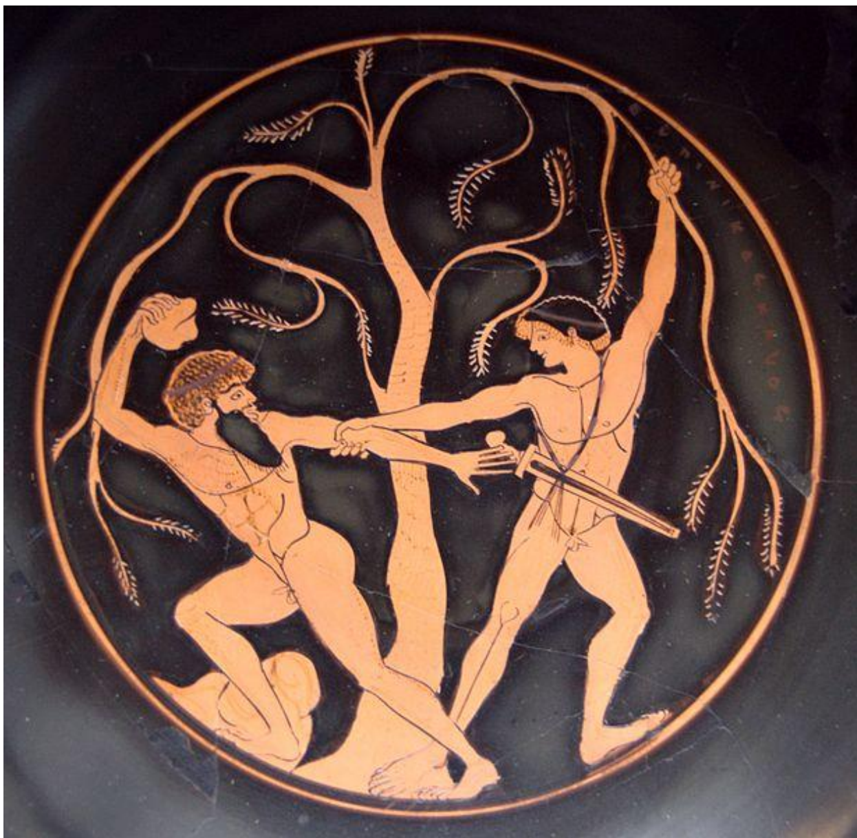
ТесейиСинид. Днокраснофигурногокилика. Атика. 490–480 гг.дон. э.