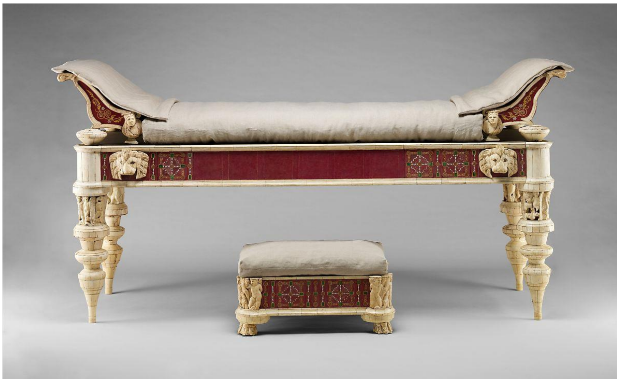
Ложе для трапезы 152