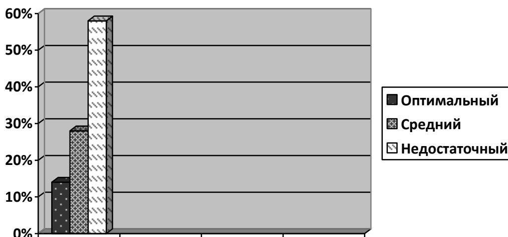
Рис. 2.2. Изучение сформированности когнитивного компонента социальной активности детей старшего дошкольного возраста (констатирующий этап)

Полученные результаты выявления уровня сформированности когнитивного компонента социальной активности дошкольников представлены ниже (рис. 2.2).