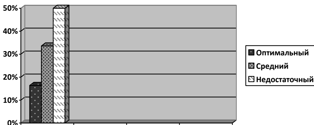
Рис. 2.4. Уровни социальной активности детей старшего дошкольного возраста (констатирующий этап)

Полученные результаты исследования уровней сформированности компонентов социальной активности дошкольников (эмоционально-ценностного, когнитивного, поведенческого) показаны ниже (рис. 2.4).