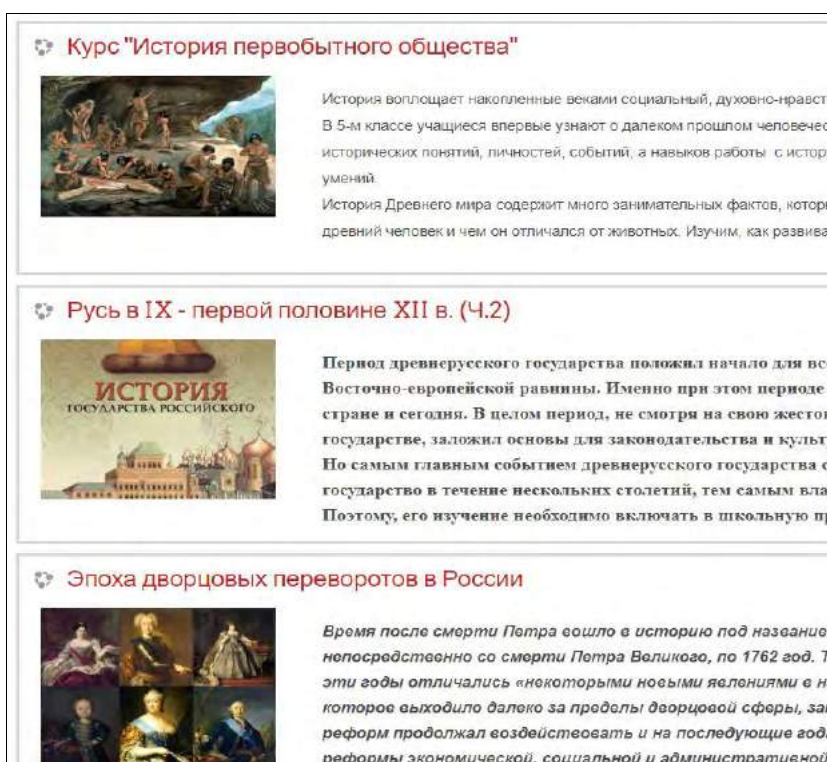
Рис.1. Курсы, созданные студентами в СЭО «Пегас» Fig. 1. Courses created by students ate-learning system «Pegas»

Для изучения курса «Информационные технологии в образовании» была разработана комфортная среда обучения в СЭО «Пегас» НИУ «БелГУ» (рис. 2).