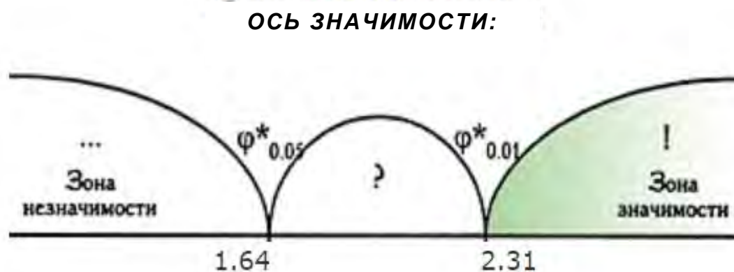
Рис. 3. Угловое преобразование Фишера Fig. 3. Fisher angular transformation

Как мы видим, количество студентов, у которых сформировалось умение разрабатывать сценарий обучения (У1) на более высоком уровне значимо увеличилось после изучения курса ( \varphi_{\text{эмп}} = 4,709 p < 0,01 и \varphi_{\text{эмп}} = 3,799 p < 0,01 ). Этот результат является достоверным по угловому коэффициенту Фишера (рис. 3).