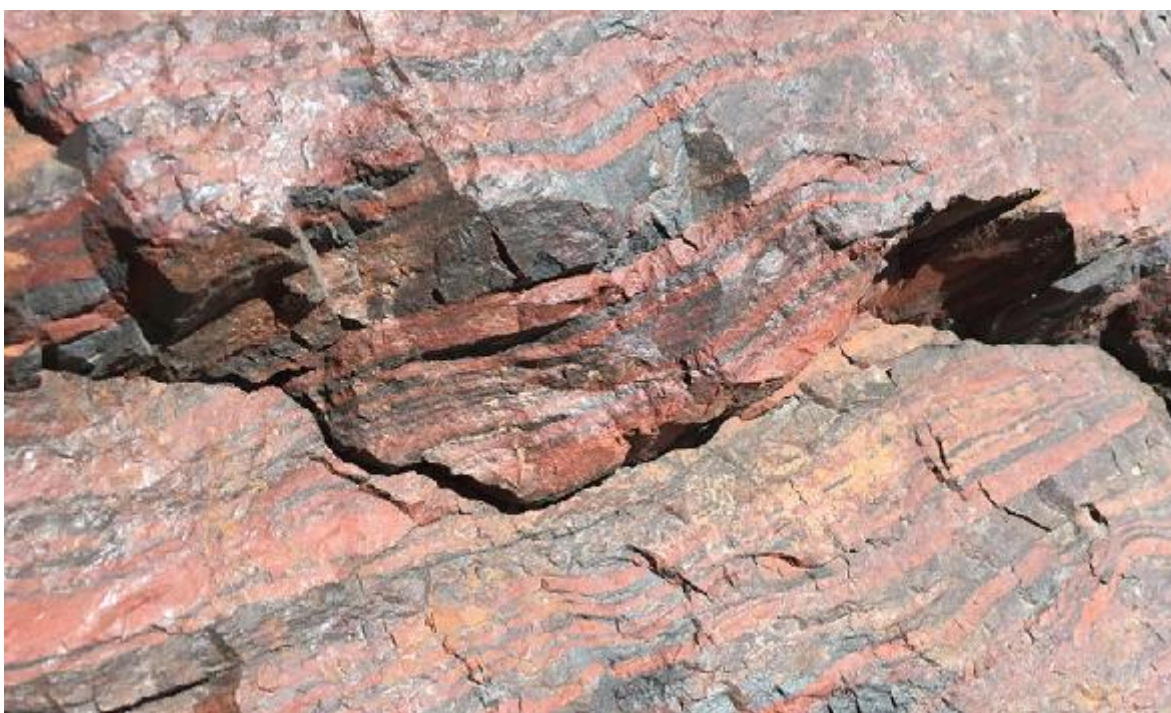
Рисунок 2 — Железистые кварциты

Сднепротерозойские образования Оскольской серии перекрывающие толщу железистых кварцитов, представлены конгломератами, кристаллическим сланцами и известняками, амфиболитами, песчаниками, доломитами.