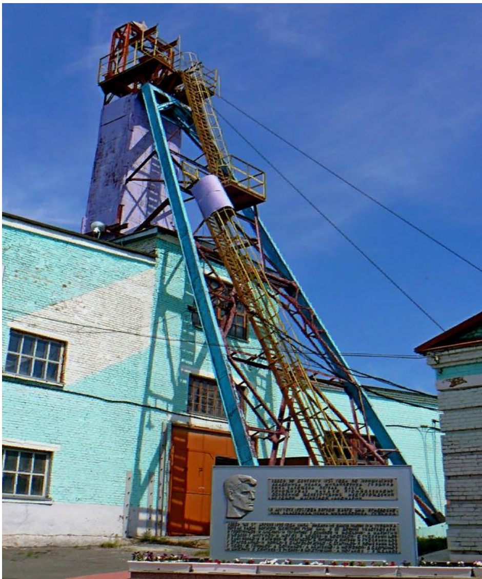
Рисунок 1 — ОА «Комбинат КМАруда»

Коробковское месторождение КМА находится в северо-восточной части бассейна и приурочена к Старооскольскому железорудному району. Комбинат показан на рис. 1