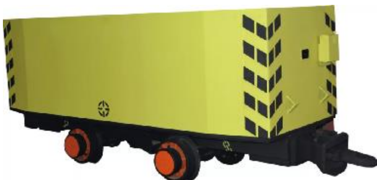
Рисунок 5 — Вагонетка

Восстающие проходятся секционным взрыванием скважин диаметром 105мм, пробуренных станками НКР-100 М.