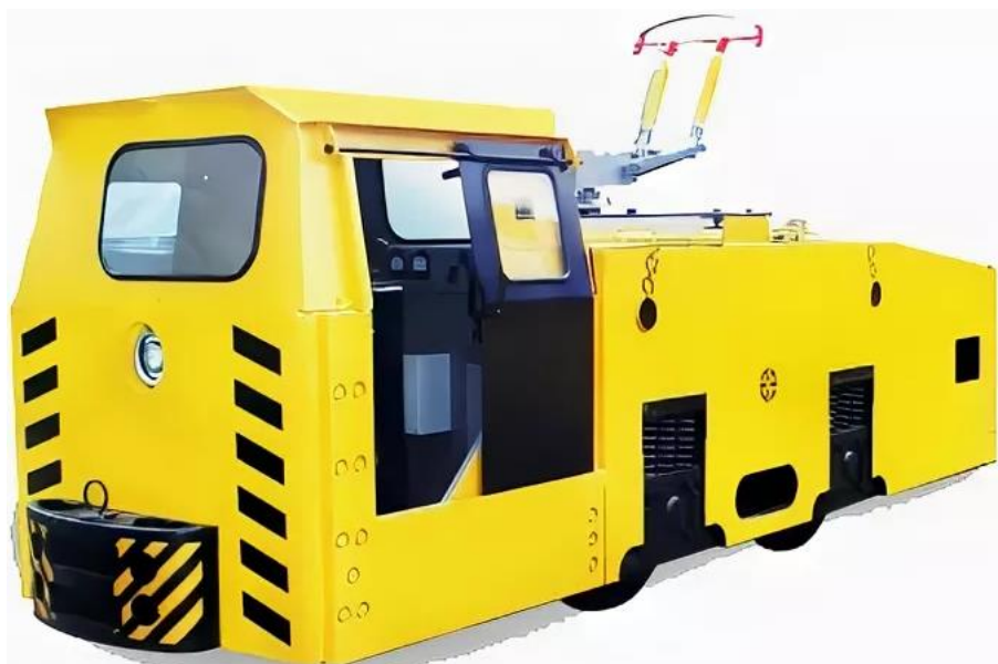
Рисунок 4— Электровоз