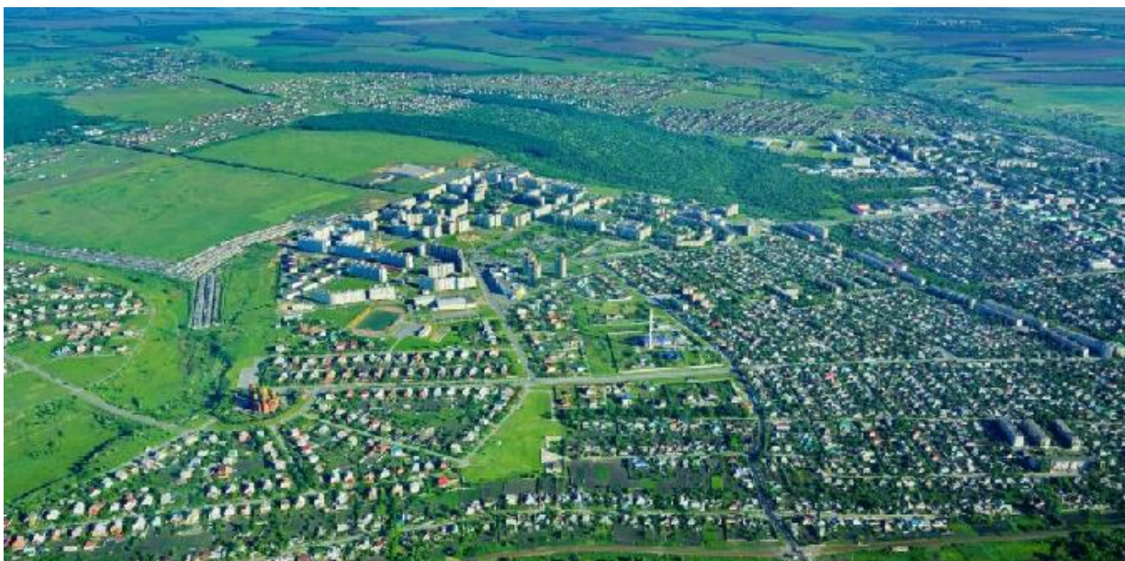
Рисунок 6 — Город Губкин

Площадь территории 1526,62 кв.км. На 2009 год в Губкинском городском округе проживало 120,1 тысяч жителей.