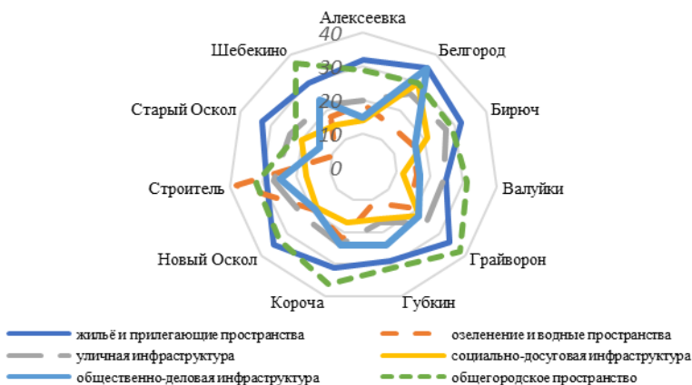
Рис. 3. Оценка пространств, входящих в индекс качества городской среды

В 2017 г. преобразования в городской инфраструктуре произошли не только в благоустройстве дворов, но и общественных зон. Знаковым объектом для города стала набережная реки Везёлка. Она была построена также по федеральному приоритетному проекту «Формирование комфортной городской среды». Её реконструированная площадь составила 18 га. Здесь организованы пешеходные и велодорожки, спортивные и детские площадки, установлены рыбацкие мостики, малые деревянные архитектурные формы, обустроена площадка для выгула собак. Работы по обустройству набережной продолжаются и в 2019 г. Предстоит масштабное озеленение – будут высажены 19 тыс. многолетних растений, обустроено 20 тыс. кв. м. газонов. В мае 2018 г. набережная пополнилась новыми арт-объектами, которые создадут участники Второго форума ландшафтного дизайна «Зелёная столица». Украшением этой рекреационной зоны стал город мастеров – «Мастерславль». На берегу был установлен экран