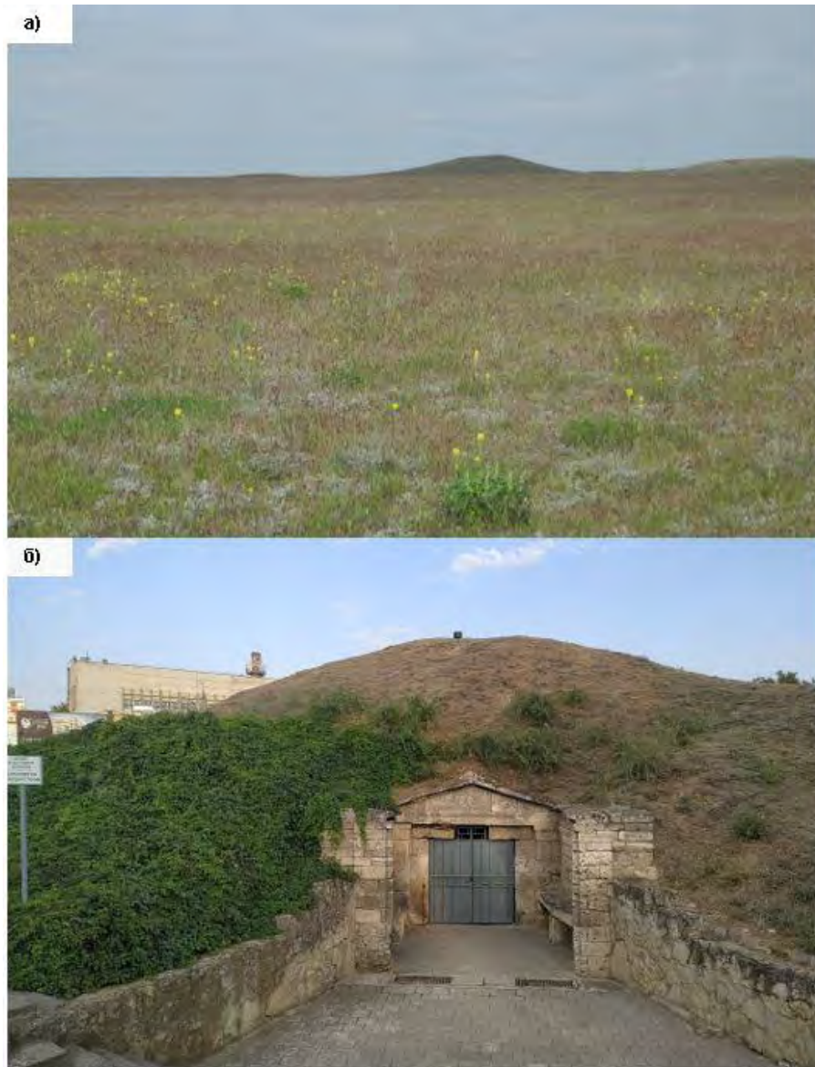
Рис. 1. Примеры современного состояния курганов: а – группа курганов к северо-востоку от Евпатории, вблизи поселений поздней бронзы и античного времени; б – объект культурного наследия федерального значения, охраняемый с 1871 г. Мелек-Чесменский курган