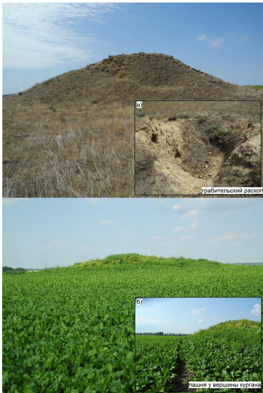
Рис. 2. Примеры повреждения курганов: а – курган, нарушенный грабительским раскопом (в 1,6 км к югу от с. Героевское) вблизи поселений IV–I вв. до н. э.; б – курган в агроландшафте (Борисовский р-н Белгородской области)

Следует отметить, что сформированные под памятниками археологии земельные участки необходимо относить к категории «земли особо охраняемых территорий и объектов» в связи с особым научным, историко-культурным, эстетическим значением и подверженностью высокому риску повреждения (уничтожения) (рис. 2, а), поскольку они в основном расположены на землях, относящихся к категории земель сельскохозяйственного назначения (рис. 2, б).