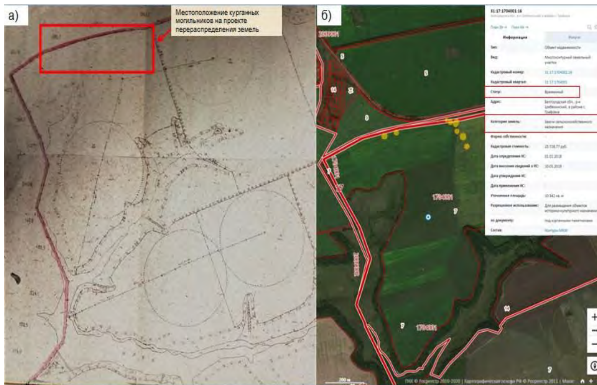
Рис. 3. Исключенные из состава земельного участка, относящегося к землям сельскохозяйственного назначения, объекты археологического наследия: а – фрагмент проекта перераспределения земель сельскохозяйственного предприятия; б – фрагмент публичной кадастровой карты