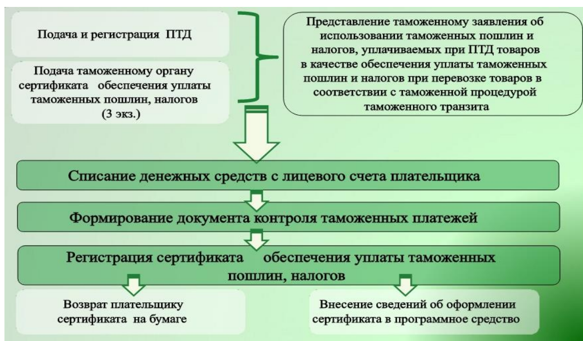
Рис. 2. Технология использования обеспечения таможенного транзита при предварительном декларировании товаров

На рисунке 3 представим технологию использования обеспечения таможенного транзита при предварительном декларировании товаров на таможенных постах Белгородской таможни.