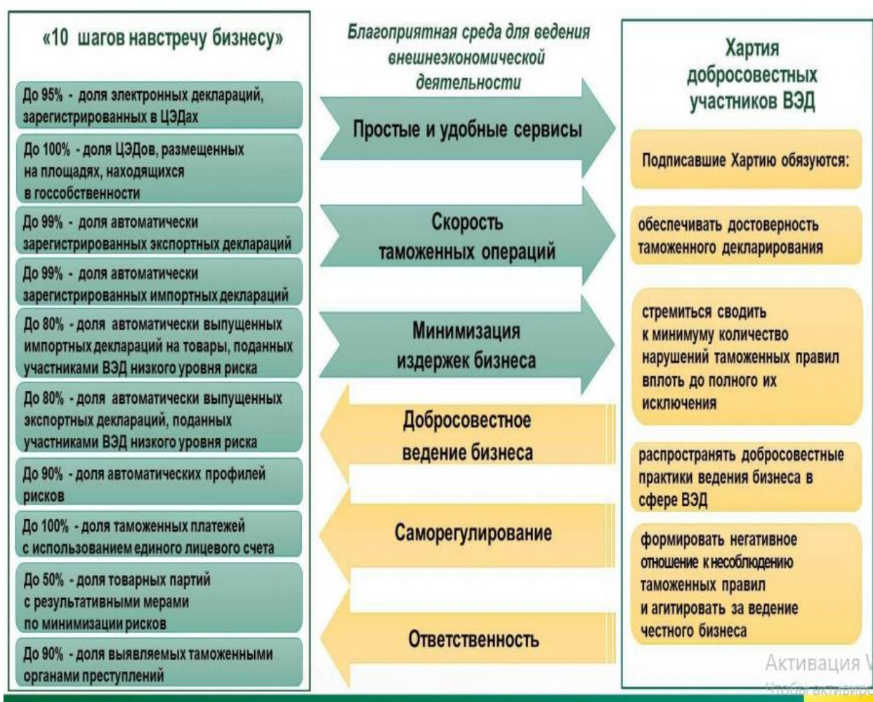
Рис. 1. Ключевые показатели «10 шагов навстречу бизнесу»

Целевые показатели, предложенные в Программе, объединены в 14 групп, а также выделены ключевые показатели (рис. 1).