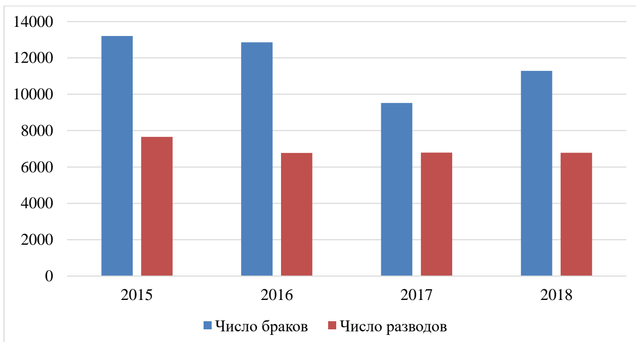
Рис. 3. Количество браков и разводов в Белгородской области, ед. 1

Далее представим данные о количестве браков и разводов.