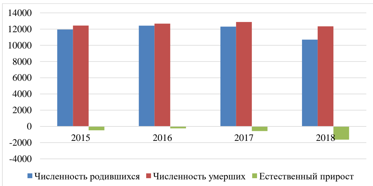
Рис. 2. Движение численности населения в Белгородской области, чел. 1

По данным рисунка видно, что численность молодежи постепенно снижается, что связано с непростой демографической ситуацией в районе. Установить причину снижения численности молодых людей в Белгородском муниципальном районе помогут данные, касаемые движения численности.