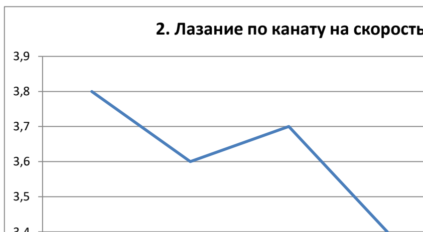
Рис. 3.2. Динамика результатов тестирования в течение эксперимента в лазании по канату