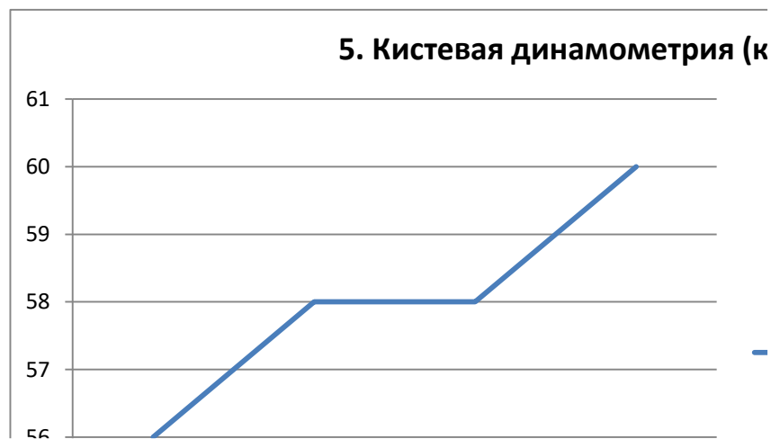
Рис. 3.5. Динамика результатов тестирования в течение эксперимента в кистевой динамометрии

Как видно на рисунках, во всех упражнениях произошло улучшение результатов за время первого макроцикла. За время же второго макроцикла в трех упражнениях из пяти показатели не изменились (это подтягивания на одной руке, вис на согнутой руке и кистевая динамометрия), а в двух упражнениях произошло ухудшение результата (это жим штанги лежа и лазание по канату на скорость). Анализ данных результатов показал, что необходимо вносить коррективы в программу подготовки. Учитывая тот малый период времени, который был отведен на переходный период, мы предположили, что это могло повлиять на недостаточное восстановление после первенства России и как следствие, снижение показателей физической