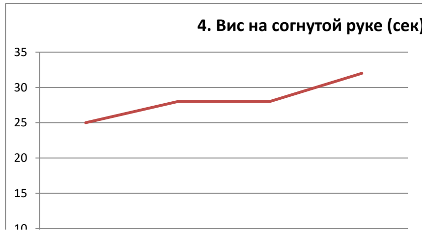
Рис. 3.4. Динамика результатов тестирования в течение эксперимента в висе на согнутой руке