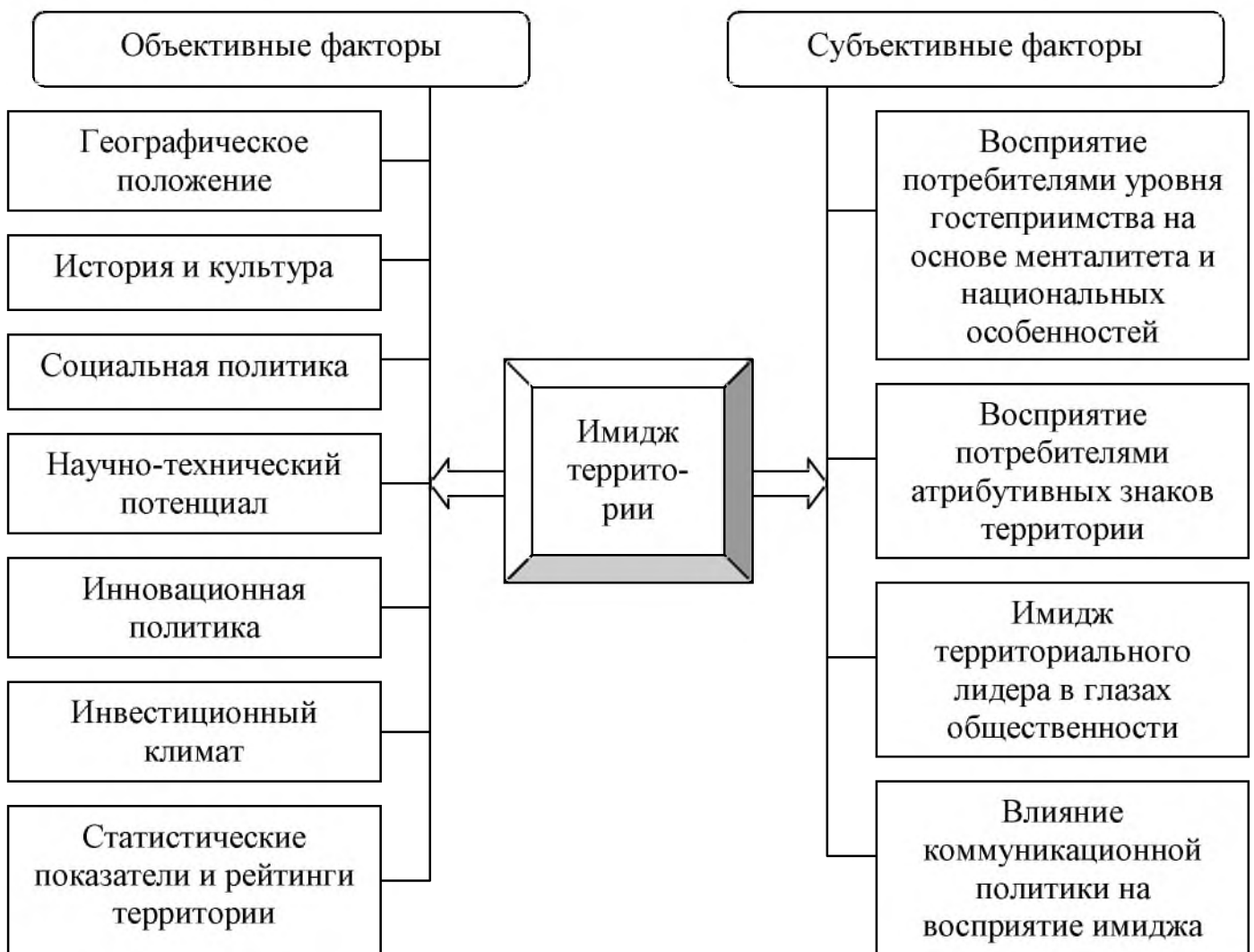
Рис. 1. Факторы, влияющие на имидж территории (региона) Fig. 1. Factors influencing the image of the territory (region)

Имидж определенной территории зависит от многих факторов. Все факторы, влияющие на имидж территории, делятся на две группы: объективные и субъективные (рис. 1).