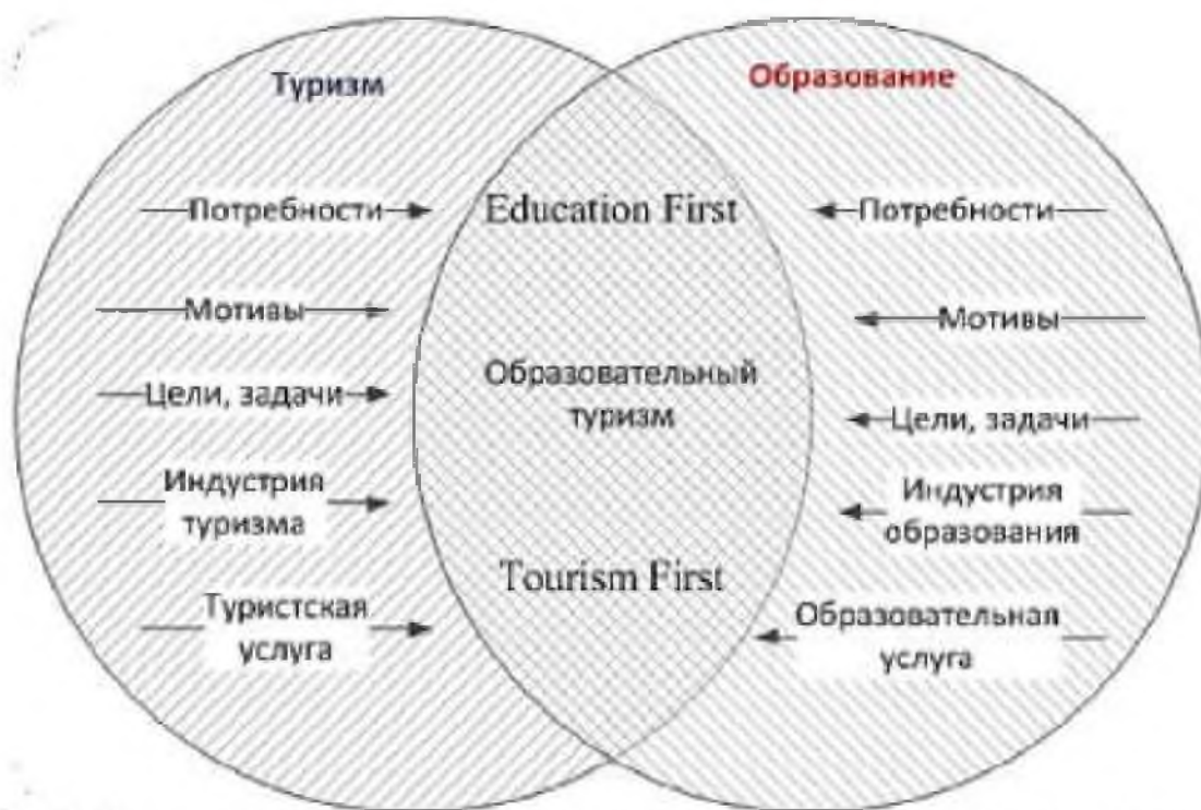
Рис. 1. Концептуализация образовательного туризма на основе сегментирования рынка образовательных и туристских услуг (на базе модели Р. Брента)

R. Brent, C. Cooper, N. Carr выделяют два основных сегмента «путешествий с целью обучения». В первом сегменте, «Tourism First», на первом месте стоит отдых, развлечение, оздоровление и др. во время туристического путешествия, а образование вторично. Во втором сегменте, «Education First», основным мотивом путешествия является образование или обучение, а туристический опыт вторичен. В нашем исследовании мы рассматриваем сегмент «EducationFirst» [1].