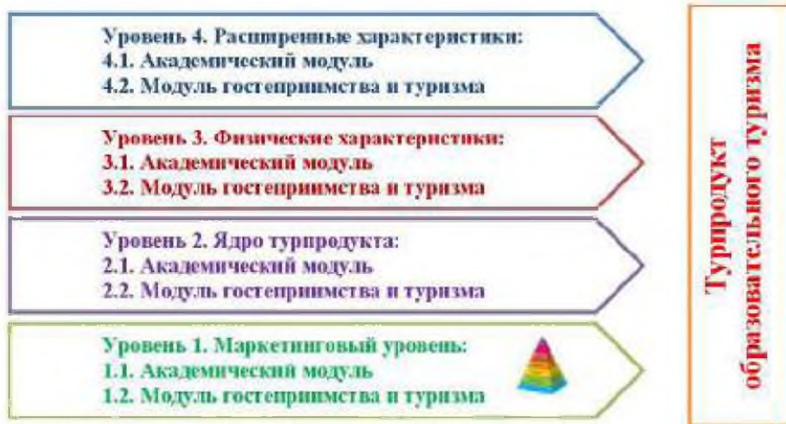
Рис. 3. Многоуровневая модель турпродукта образовательного туризма Fig. 3. Multilevel model of the tourism product of educational tourism

На рис. 3 представлена модель туристского продукта образовательного туризма, которую мы построили на основе известных моделей товара [4].