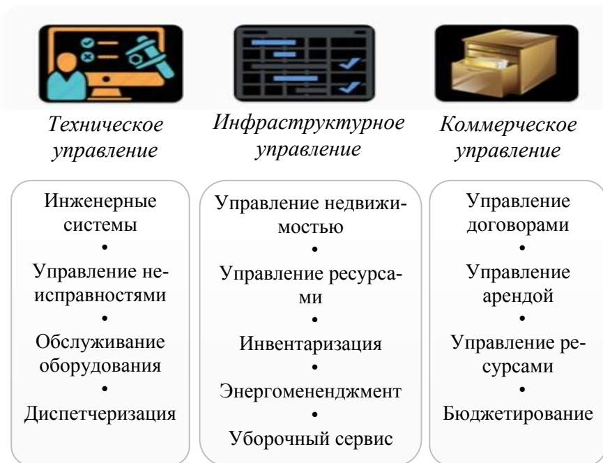
Рис. 2. Функциональные модули управления эксплуатацией объекта на основе технологии информационного моделирования

ленной, жилой или коммерческой. Например, правительство Великобритании, как одной из ведущих стран по использованию BIM-технологий, санкционировало использование BIM-моделей применительно ко всем объектам общественного строительства, начиная с 2016 г., с включением передачи цифровых данных, требуемых для этапа эксплуатации здания.