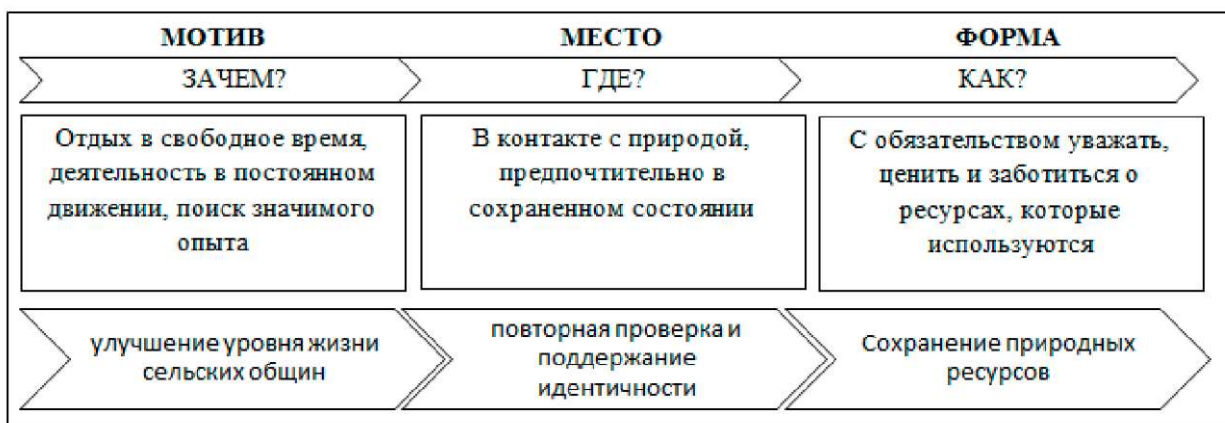
Рис. 1. Характерные моменты альтернативного туризма Fig. 1. Typical moments of alternative tourism

ление узнать и испытать культуру данного сообщества.