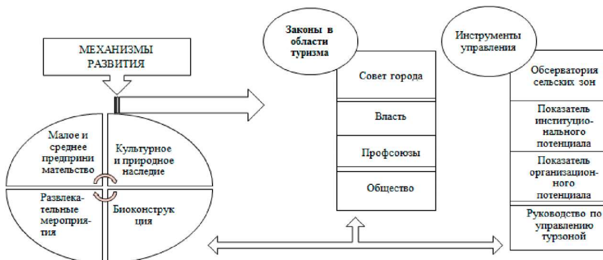
Рис. 4. Модель управления устойчивым альтернативным туризмом Fig. 4. The management model for sustainable alternative tourism

Таким образом, альтернативный туризм требует разработки долгосрочного плана и государственной политики, опирающихся на непрерывный процесс развития на местах, экологическое просвещение и реинвестирование части финансовых ресурсов в тех местах, где эта деятельность осуществляется в рамках всеобъемлющего плана развития страны.