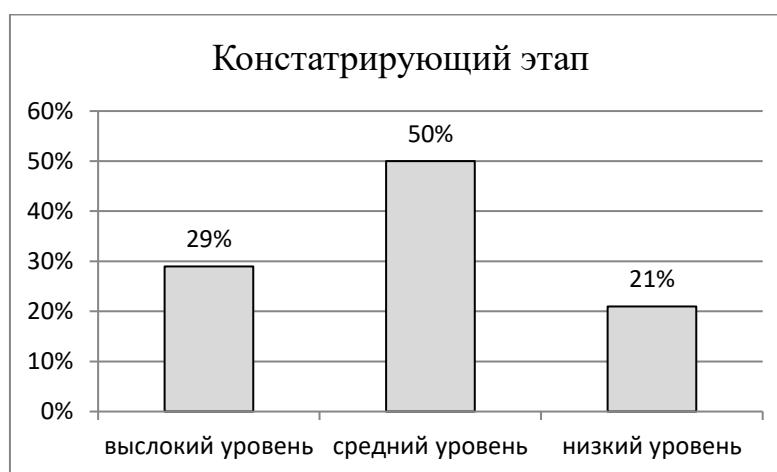
Рис. 2.1. Уровень навыков учебного сотрудничества младших школьников

Из таблицы мы видим, что высокий уровень навыков учебного сотрудничества имеют немногие ученики – всего 8 человек. Преобладает средний уровень навыков – половина класса 14 учеников. Есть ученики, имеющие низкий уровень – это 6 человек. Результаты диагностирования навыков учебного сотрудничества младших школьников мы представили в виде диаграммы (см. рис. 2.1).