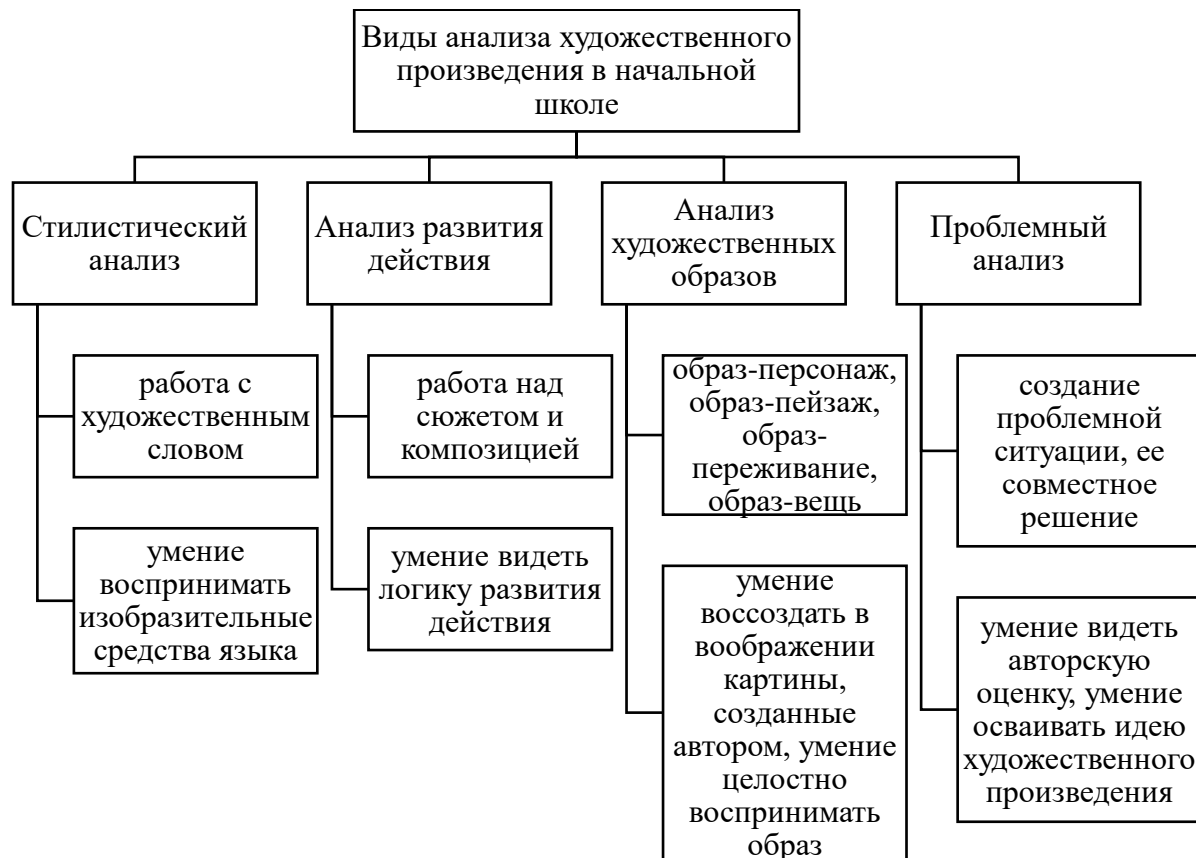
Рис. 1.1. Виды анализа художественного произведения в начальной школе

Любой читатель (в этой роли может выступать и специалист-литературовед) прежде всего, имеет дело с текстом литературного произведения, художественным текстом. И составить свое мнение о нем, сформулировать для себя его личностный смысл должен на основании того, что сказано автором в тексте. Т.е. можно говорить о самодостаточности художественного текста: в нём содержится всё, что необходимо для его понимания, и нет необходимости в дополнительных комментариях разных видов, объяснениях, справочных текстах и т.п.