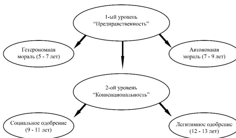
Рис. 1.1. Возрастные уровни духовно-нравственного развития младших школьников (по Л. Кольбергу)

Усвоенные от взрослых нормы морали и нравственности трактуются ребенком как обязательные правила поведения, нарушение которых может повлечь за собой наказание, а соблюдение, соответственно, поощрение. Поэтому дети в 1-2 классе характеризуются старанием и прилежностью как стремлением получить вознаграждение в виде хорошей оценки и похвалы. На этой стадии дети часто критически оценивают поведение сверстников, некритически оценивая себя, и могут ябедничать, сообщая о нехороших поступках одноклассников учителю в стремлении заслужить похвалу. Эту стадию развития дети проходят в возрасте 5-7 лет (Кольберг, 2015, 12).