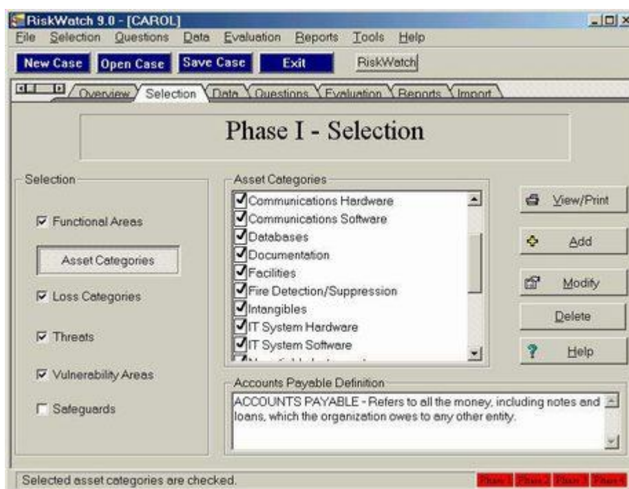
Рис. 2. Инструментальное средство RiskWatch

Интерфейс инструментального средства RiskWatch представлен на рисунке 2.