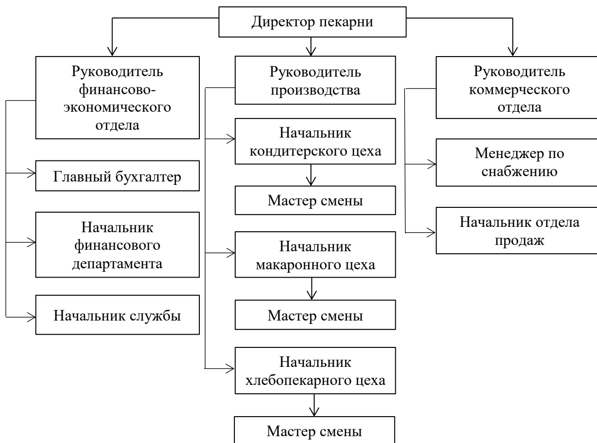
Рис. 2.1 Схема управления пекарни ООО «Гиперглобус»

Особенность её заключается в том, что на производственном и обслуживающем уровне структуры организации происходит обособление функций по группе клиентов. Это позволяет сосредоточить внимание на запросах определенных групп клиентов или рынков. При этом у клиента должно создаться впечатление, что организация работает только на него.