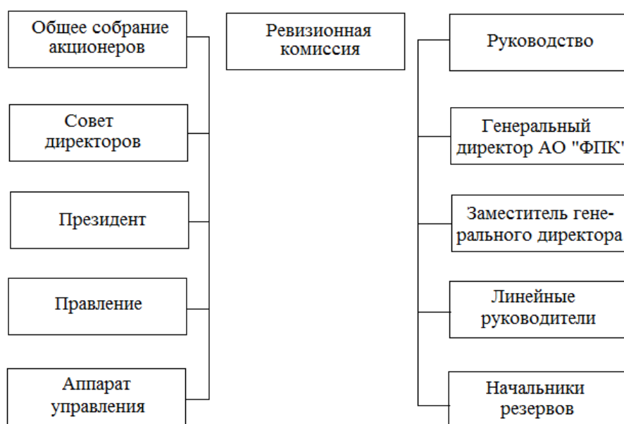
Рис. 2.3. Структура управления АО «ФПК»

Миссия компании АО «ФПК»: "Мы улучшаем качество жизни, делая Вашу поездку безопасной, доступной и комфортной".