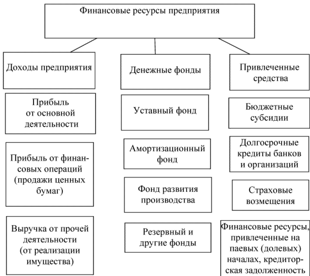
Рис. 1.1. Структура финансовых ресурсов предприятия