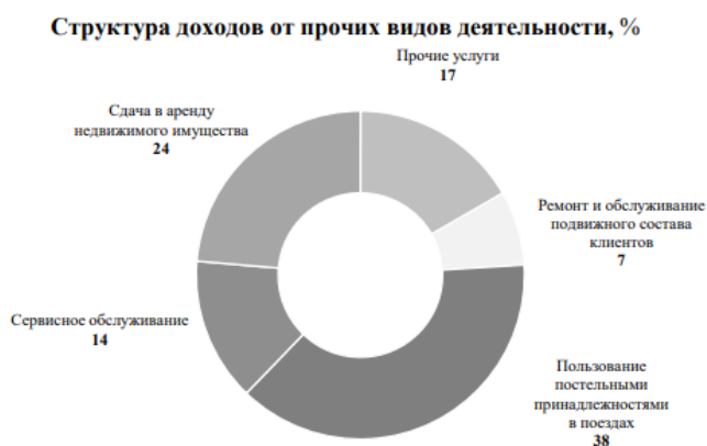
Рис 2.4. Структура доходов от прочих видов деятельности за 2018 год

Доходы от прочих видов деятельности в 2018 году составили 23,7 млрд. руб., что на 5,4% выше, чем в 2017 году. В 2017 году составили 22,5 млрд. руб., что на 6,7 % выше уровня 2016 года. При этом за 2017 год потребность в аренде пассажирских вагонов сторонним клиентам увеличилась на 37,0 % к факту 2016 года, в ремонте подвижного состава клиентов – уменьшилась на 9,4 % к факту 2016 года. В общем объеме доходных поступлений доля доходов от прочих видов деятельности составляет порядка 10,4 % в 2017 году против 10,5 % в 2016 и 2018 годах.