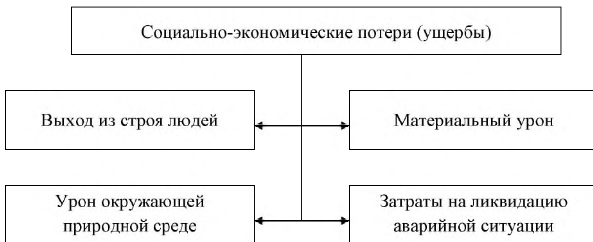
Рис.1. Структура социально-экономического ущерба от аварийных ситуаций на водохранилищах

Задача оценки социально-экономического ущерба от аварийных ситуаций на водохранилищах сводится к анализу характера и содержания составляющих социально-экономического ущерба и определению количественных значений уровня отдельных составляющих социально-экономического ущерба.