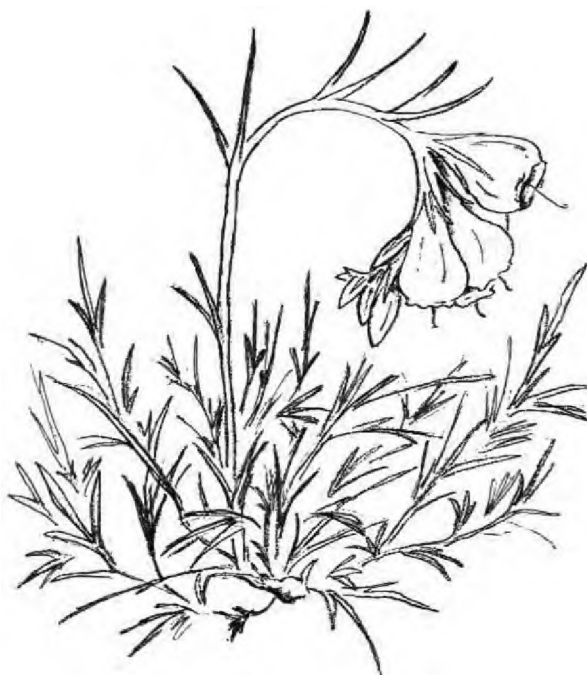
.4. ( Onosma simplicissima L.)

... .. ... .. ... .. : — , 2008. 183 . ... .. : : — , 2010. 212 . ... .. // . . , 1975. 2. . 7-34. - : http://www.plantarium.ru