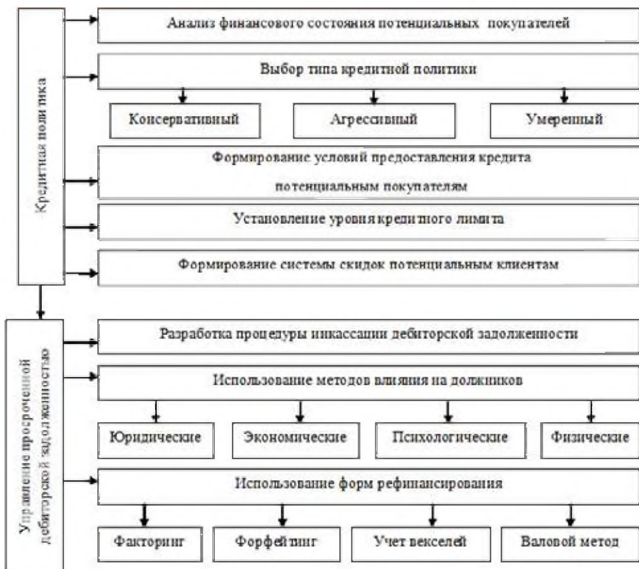
Рис. 3. Этапы управления дебиторской задолженностью на предприятии Fig. 3. Stages of Management of Receivables at the Enterprise

Консервативный тип имеет целью снижения кредитного риска. Эта кредитная политика предусматривает жесткую процедуру отбора покупателей продукции предприятия за счет анализа его финансовой отчетности; уменьшение сроков погашения обязательств; установление уровня кредита; применение жестокой процедуры по инкассации дебиторской задолженности. Применяя этот метод, у предприятия не будет возможности получить дополнительную прибыль, но так оно обеспечит минимальный кредитный риск [2].