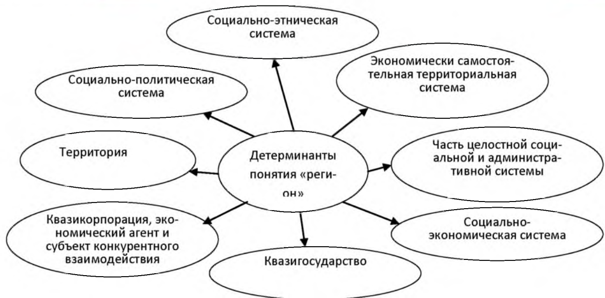
Рис. 2. Доминирующие императивы понятия «регион» Fig. 2. The dominant imperatives of the concept of "region"

Целевыми показателями регионального развития выступают социальные нормы потребления, уровень и качество жизни. Объектом управления является региональный социально-экономический комплекс и его элементы. Предмет управления – отношения между субъектами хозяйствования по поводу эффективного использования региональных ресурсов в целях решения социально-экономических проблем развития региона. Основной субъект управления в регионе – население.