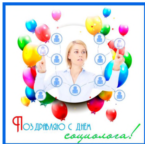
Рис. 2. Открытка «Поздравляю с Днём социолога!» [4]