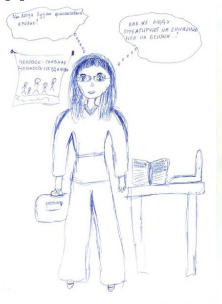
Рис. 3. Рисунок «Социолог» (автор обучается по программе направления подготовки «социальная работа»)