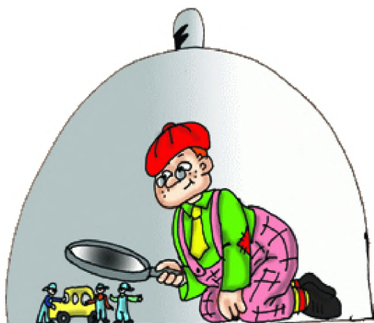
Рис. 1. Открытка «С Днем социолога» [7]

рассмотрением людей (рис. 1). Образы формировали, скорее всего, те, кто имеет непосредственное отношение к социологии. Кроме того, мы попросили студентов нарисовать социолога (рис. 3, рис. 4). Большая часть рисунков не отражает отличий представителя этой профессии от обычного человека с неопределенной профессиональной принадлежностью.