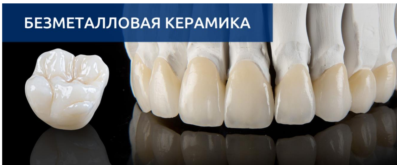
Рис. 4. Безметалловая керамика