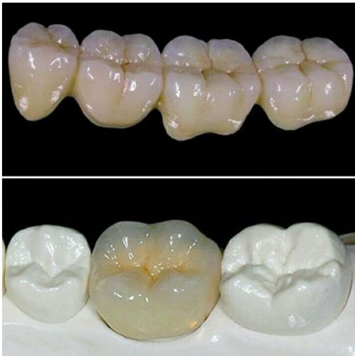
Рис. 2. Пресс-керамика жевательных зубов