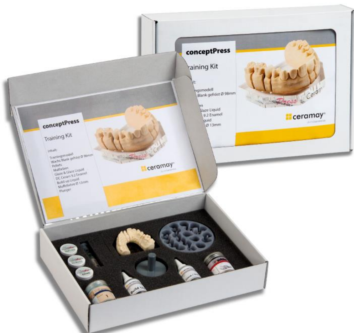
Рис. 3. Расходный материал для пресс-керамики