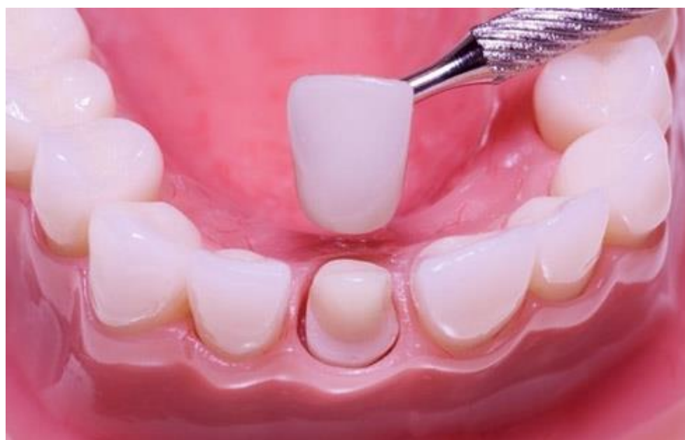
Рис. 5. Реставрация коронки зуба