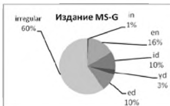
Рис. 4. Виды морфов в издании MS-G

Несмотря на множество вариаций форм в издании G, согласно статистическим данным можно сказать, что издания MS-F и MS-G очень похожи по наличию идентичных по форме окончаний, которые немного совпадают по количественной характеристике: MS-F: -en (6%), -id (2%), -yd(e) (5%), -ed (16%) и сильные глаголы с чередованием в корне (71%). и MS-G: in – 5 (1%), -en – 46 (15%), -id – 32 (10%), -yd – 9 (3%), -ed – 31 (10%), сильные глаголы с чередованием в корне – 180