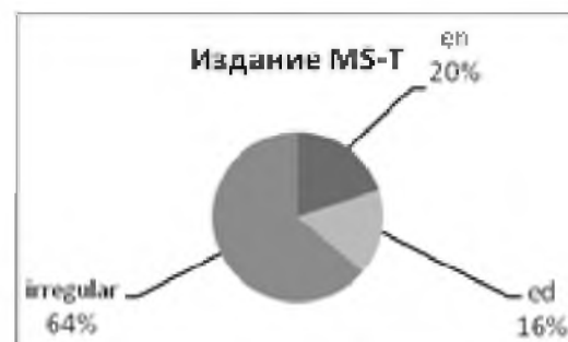
Рис. 2 Виды морфов в издании MS-T