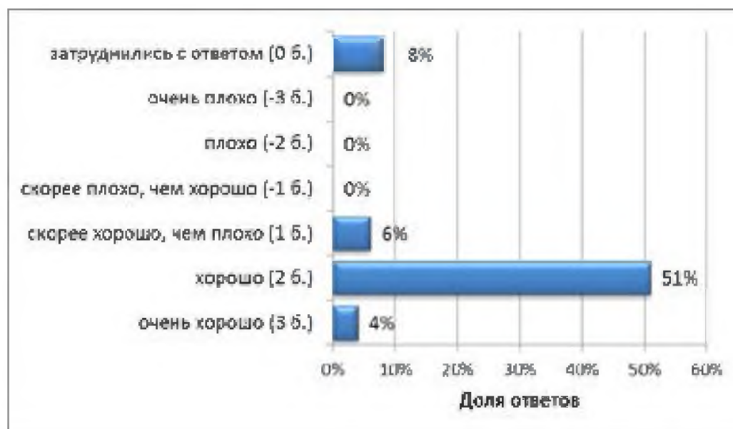
Рис. 3. Оценка формулярной системы в медицинских организациях Омской области (2013; 50 респондентов)

Проведенный нами анализ ответов респондентов показал, что более половины опрошенных оценили формулярную систему, действующую в Омской области, как «хорошую» – 51% руководителей – и «очень хорошую» – 4% (рис. 3).