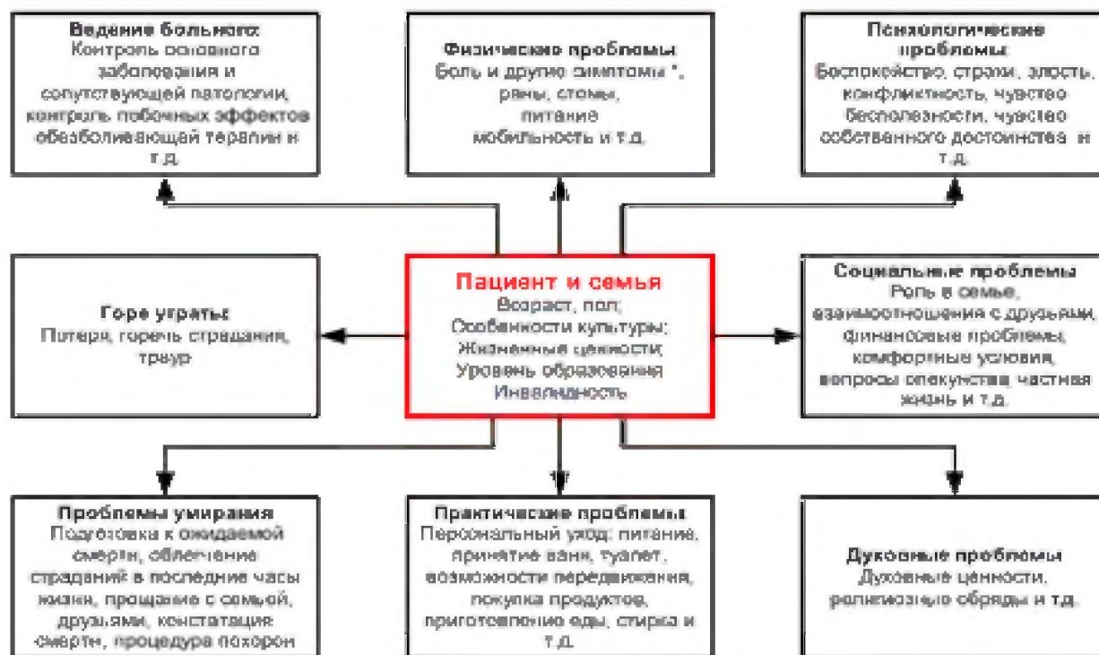
Рис.1. Основные проблемы терминального больного и членов его семьи Fig.1. The main problems of the terminally ill and their families

В этой связи важнейшей составляющей процесса поддержания качества жизни больного является духовность – в частности, так она рассматривается в зарубежной практике оказания онкологической, гериатрической, паллиативной помощи. Во многих крупных медицинских центрах онкологической и паллиативной направленности духовенство, священники, капелланы и сестры милосердия представлены не как вспомогательный, а как основной персонал лечебного учреждения, который наравне с медиками и психологами оказывает соответствующую духовную помощь пациентам [9].