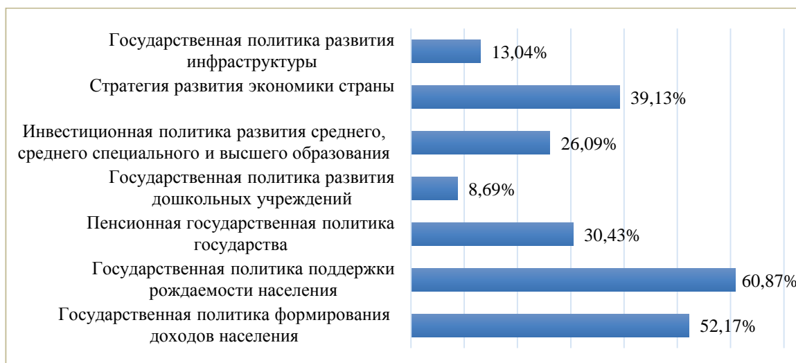
Рис. 2. Распределение ответов на вопрос: «Какие внешние факторы оказывают наибольшее влияние на демографические процессы в регионе?»

Особое место среди внешних факторов, оказывающих наибольшее влияние на демографические процессы в области, занимают государственная политика поддержки рождаемости населения, политика формирования доходов населения и стратегия развития экономики страны (рисунок 2). Таким образом, эксперты отмечают взаимосвязь экономического развития и воспроизводства населения, выражающаяся в виде воздействия уровня жизни на демографические процессы.