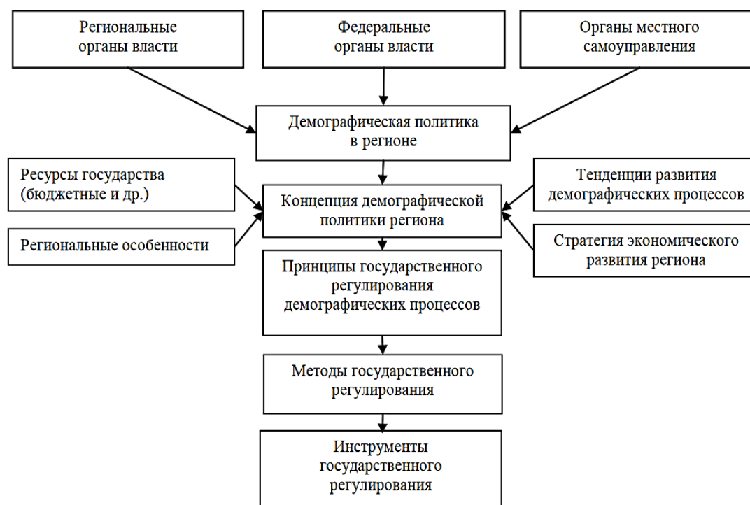
Рис. 1. Концептуальная схема государственного регулирования демографических процессов

Перед формированием комплекса мер государственного регулирования демографических процессов осуществляется определение приоритетных направлений демографической политики в регионе. Основным документом, содержащим основные мероприятия, направленные на улучшение демографической ситуации в регионе, учитывающим региональные особенности процессов воспроизводства населения, социально-экономическую стратегию развития региона, является концепция демографического развития. Данная концепция содержит основные принципы государственного регулирования демографических процессов, опираясь на которые региональные власти определяют методы воздействия на численность населения. В свою очередь, данные методы включают совокупность инструментов (средств), направленные на стабилизацию численности населения, повышение качества жизни 1 .