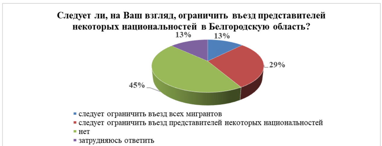
Рис. 3. Распределение ответов респондентов о необходимости ограничения въезда представителей некоторых национальностей в регион

результатам, опрошенные в первую очередь идентифицируют себя с политическим сообществом («гражданин России» – 42,1%). Каждый четвертый респондент (26,2%) ощущает себя «просто человеком». На третьем месте этническая принадлежность – «представителем своего народа» считают себя 12,9%. Примечательно, что жителем Белгородской области ощущают себя всего 7,7%, а жителем своего населенного пункта – 5,52%. Эти данные опровергают теоретические построения С. Хантингтона, в соответствии с которыми для современных россиян, так же как для представителей других цивилизаций, гражданская идентичность вторична, а этническая и религиозная первичны и именно они определяют судьбы народов и государств.