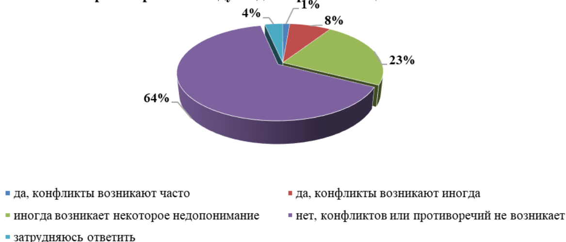
Рис. 2. Распределение ответов респондентов о возможных конфликтах между людьми разных национальностей в месте их проживания

Практически каждый четвертый житель области убежден, что иногда все же возникает некоторое недопонимание между людьми (23%). Формами реализации конфликтов респонденты назвали такие, как наглость, хамское поведение (68,4%); оскорбления (62%); драки, потасовки, хулиганство (19,8%); преступления (9,2%) 1 . Основными причинами возникновения конфликтов, по мнению опрошенных, выступают: незнание культурных особенностей друг друга (64,2%), разрыв уровня жизни разных народов (21,7%), неравное отношение власти к разным народам (15%), целенаправленное разжигание межнациональной розни политиками и средствами массовой информации (14,7%), закрытость этнических общин для контактов с другими народами (14,2%), этническая преступность (14,2%).