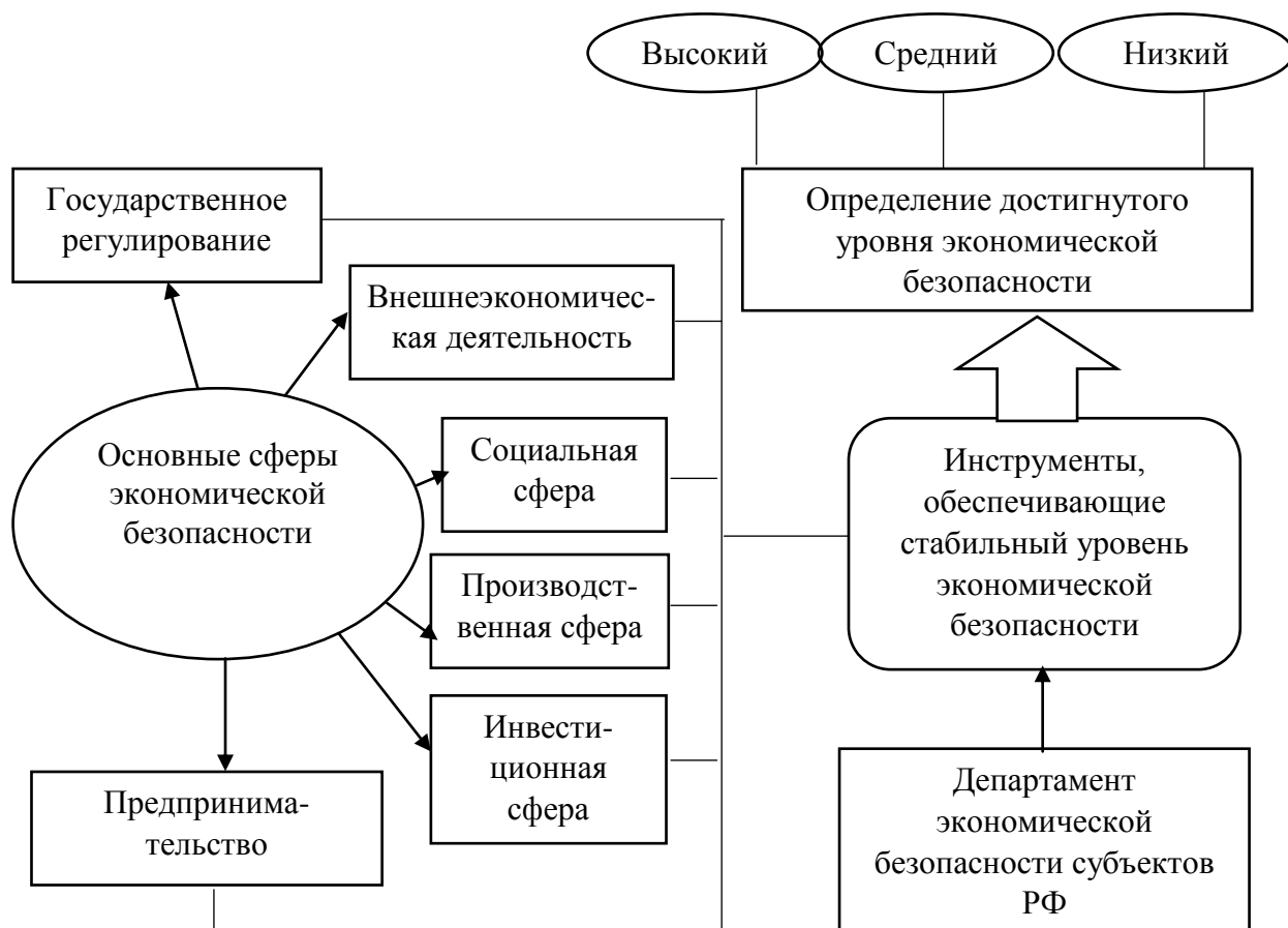
Рис. 3.2. Механизм регулирования уровня экономической безопасности регионов Российской Федерации

только на принципах и механизмах этих сфер. В качестве предложения по достижению стабильного уровня экономической безопасности представим схему (см. рис. 3.2).