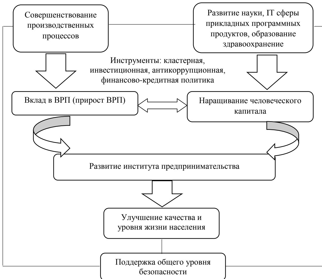
Рис. 3.1. Модель управления экономической безопасностью регионов

экономической безопасности регионов. Механизм экономической безопасности включает в себя: модель управления экономической безопасностью (рис. 3.1), схему путей повышения уровня экономической безопасности регионов РФ (рис. 3.2) и схема достижения экономической безопасности.