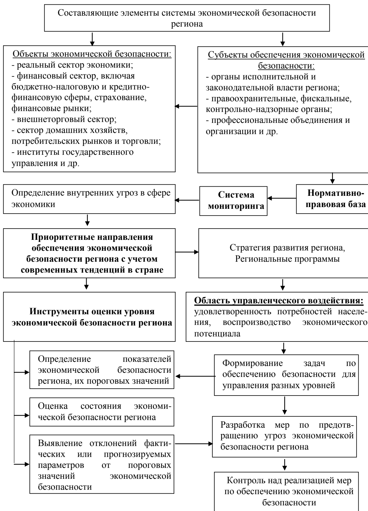
Рис. 1.3. Методика построения эффективной системы обеспечения экономической безопасности региона в аспекте национальной безопасности страны

Составлено автором по материалам 12, 17, 32.