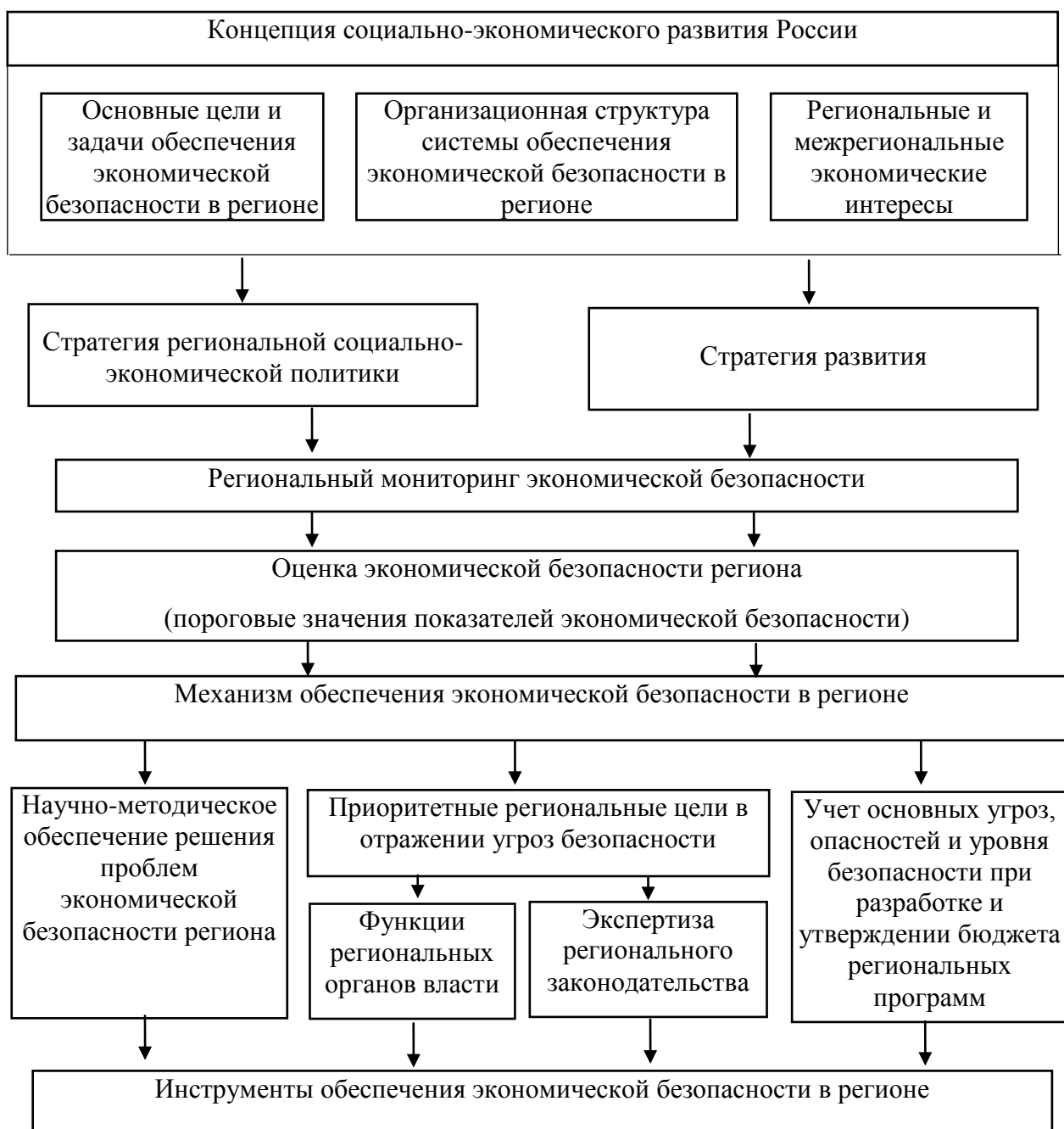
Рис. 2.2. Модель системы обеспечения экономической безопасности в Белгородской области

Модель системы обеспечения экономической безопасности в Белгородской области представлена на рисунке 2.2.