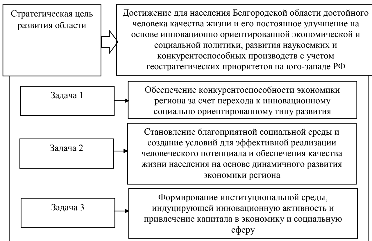
Рис. 2.1. Цель и задачи Плана мероприятий по реализации Стратегии социально-экономического развития Белгородской области на период до 2025 года

Рассмотрим цель и задачи Плана мероприятий по реализации Стратегии социально-экономического развития Белгородской области на период до 2025 года, как важнейшие элементы системы экономической безопасности Белгородской области в 2015-2017 гг. (рис. 2.1).