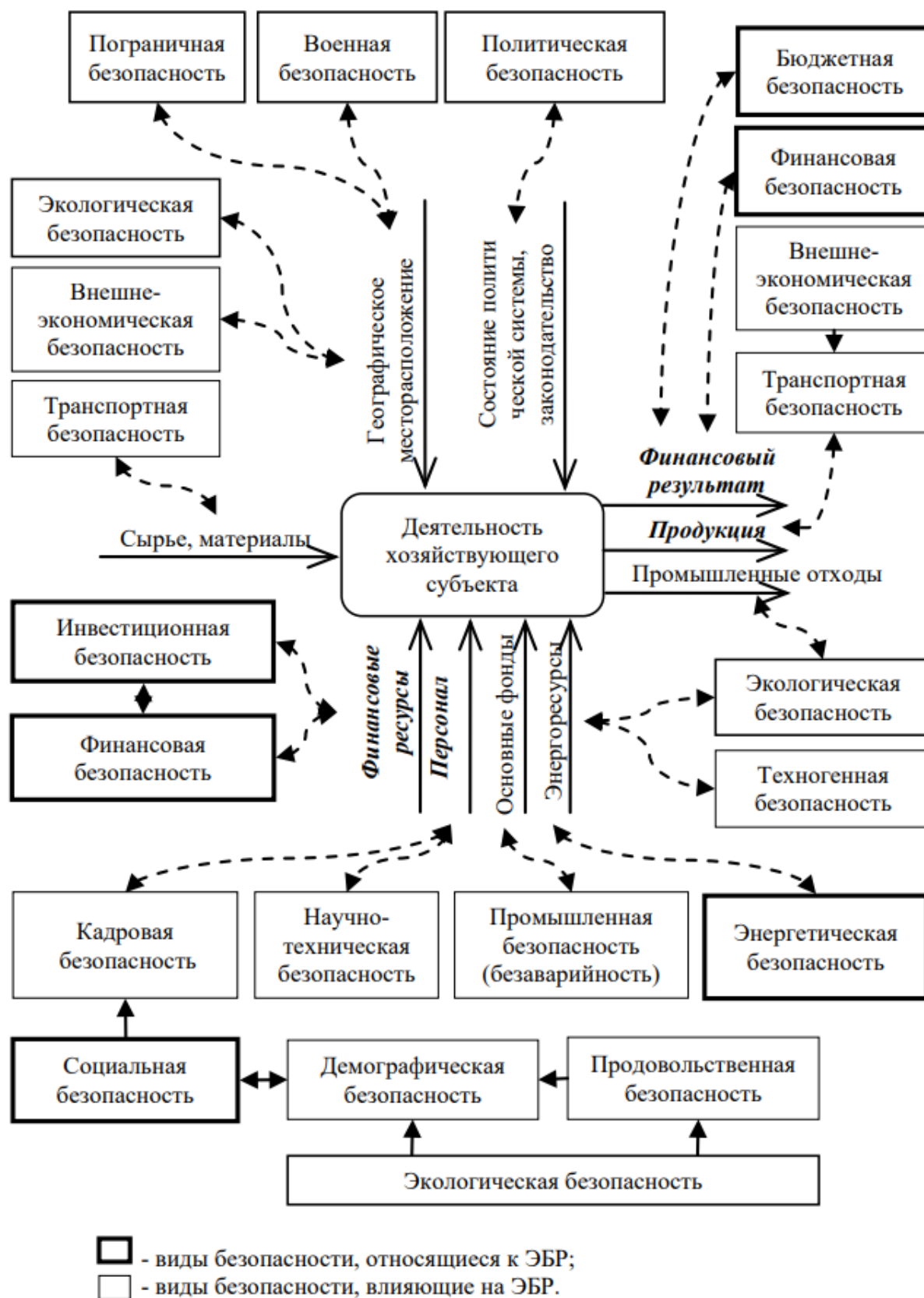
Рис. 1. Взаимосвязь видов безопасности в экономике региона