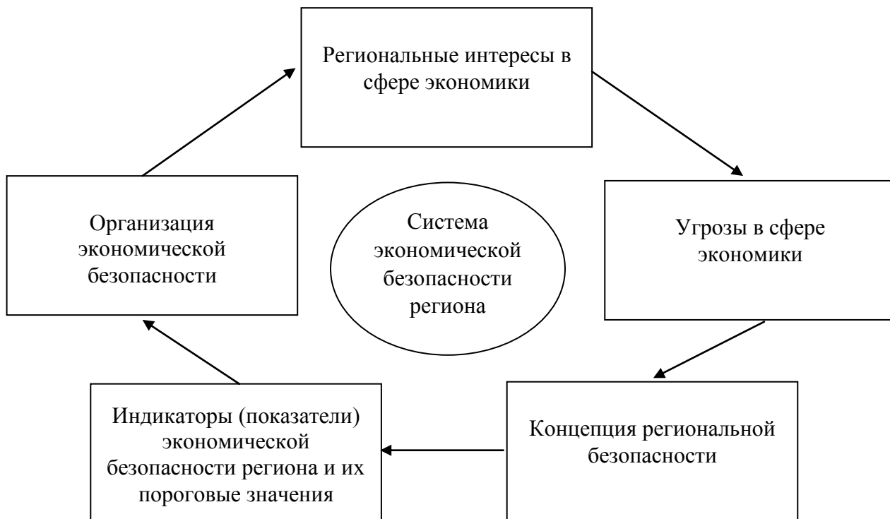
Рис. 1.2. Составные элементы системы экономической безопасности региона

Составные элементы системы экономической безопасности региона рассмотрены на рисунке 1.2.