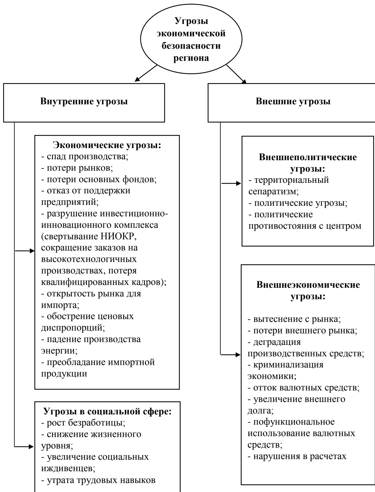
Рис. 1.1. Угрозы экономической безопасности региона

Нужно учитывать, что многие деструктивные процессы носят межрегиональный характер. Угрозы экономической безопасности регионов показаны на рисунке 1.1.