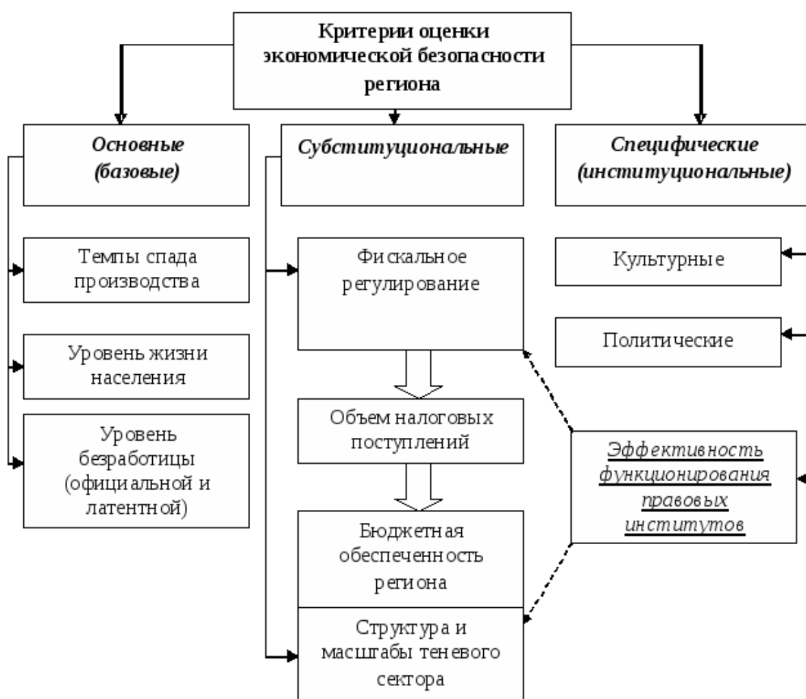
Рис. 1.4. Критерии оценки эффективности системы экономической безопасности региона

анализ состояния региональной экономики, а также обнаружить наиболее критичные направления. Следовательно, пороговыми в данном контексте обозначаются предельные величины, несоответствие которым мешает нормальному развитию различных составных компонентов воспроизводства, способствующих образованию отрицательных, разрушительных воздействий в сфере экономической безопасности [2]. При установлении пороговых величин первостепенно следует принимать во внимание стратегические интересы субъекта Федерации, так как после достижения целей по каждому отдельному направлению, регион сможет перейти на новую ступень развития.