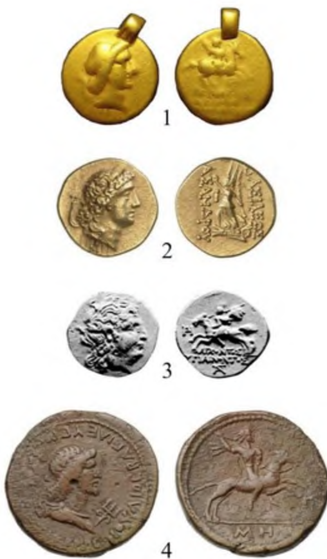
Рис. 2. К атрибуции золотой монеты: 1 – ее качественное фото; 2 – статер Асандра; 3 – драхма Гигиэнонта, 4 – сестерций Рескупорида I Fig. 2. To the attribution of a gold coin: 1 – its high-quality photo; 2 – stater of Asander; 3 – drachma of Hygiainon, 4 – sestertius of Reskuporid I