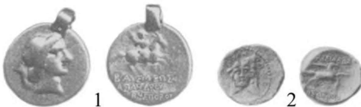
Рис. 1. Золотая и бронзовая монеты, отнесенные В.А. Анохиным к выпуску царя Асандра Fig. 1. Gold and bronze coins attributed by V.A. Anokhin to the release of King Asander