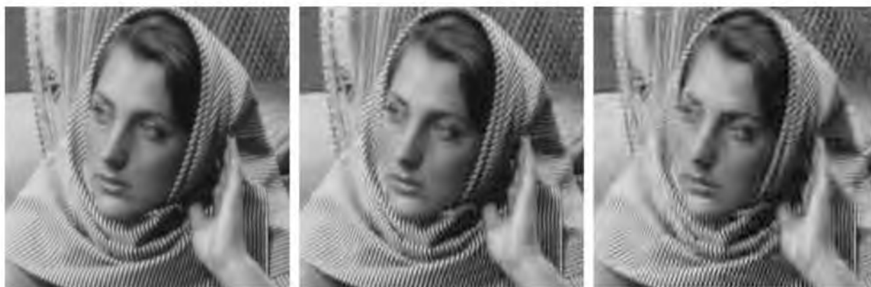
Рис. 4. Результаты сжатия с использованием DWHT для R = 1, 4, 8