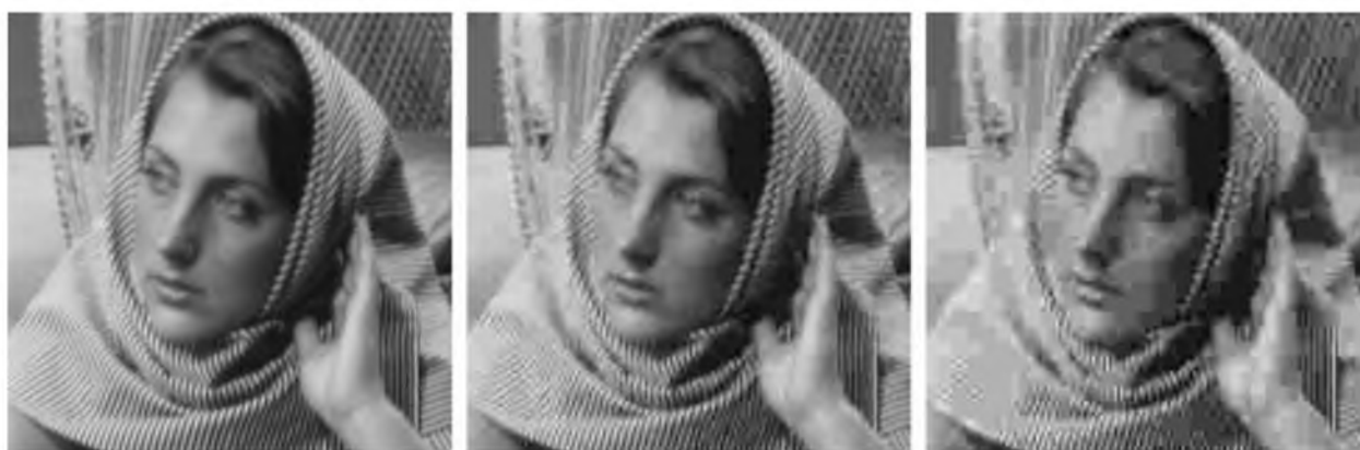
Рис. 3. Результаты сжатия с использованием DCT для R = 1, 4, 8 Fig. 3. Compression using DCT for R = 1, 4, 8