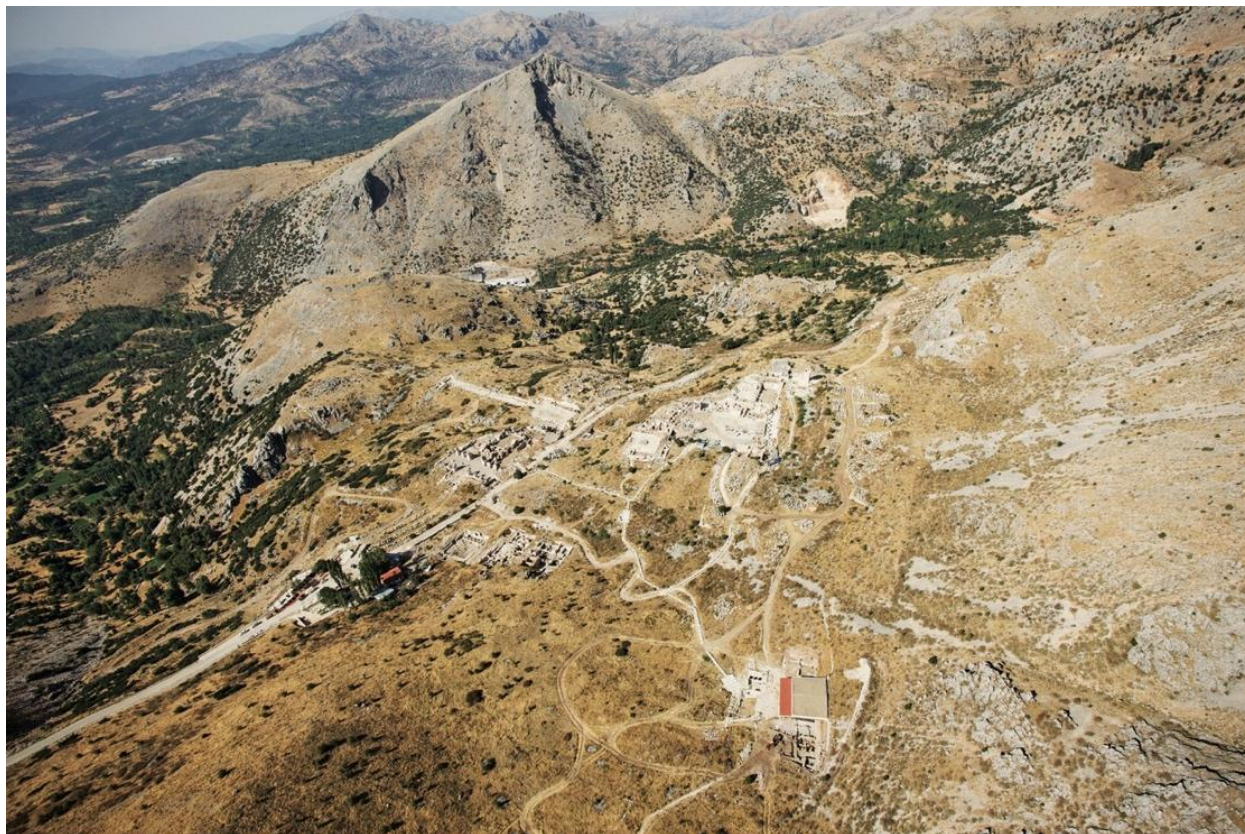
Рис. 1. Сагаласс, вид с воздуха на верхнюю и нижнюю части города (Археологический исследовательский проект Сагаласса)