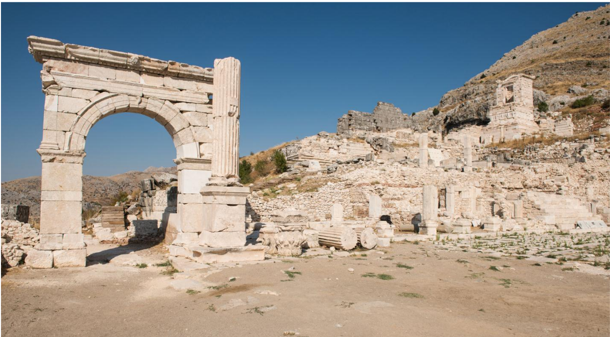
Рис. 3. Арка Калигулы, повторно посвященная Клавдию в 42 г. Справа – пьедестал и нижние барабаны почетной колонны, установленной Демосом в честь Кратера, сына Калликла.

Верхняя агора. В первой четверти I в. центр города был полностью застроен монументальными сооружениями. К концу этого века Верхняя Агора эллинистического времени была расширена на запад и увеличена вдвое, заняв площадь 2 380 м 2 . Агора была вымощена незадолго до строительства юго-западной арки, посвященной Калигуле (37–41 гг.) (рис. 3).