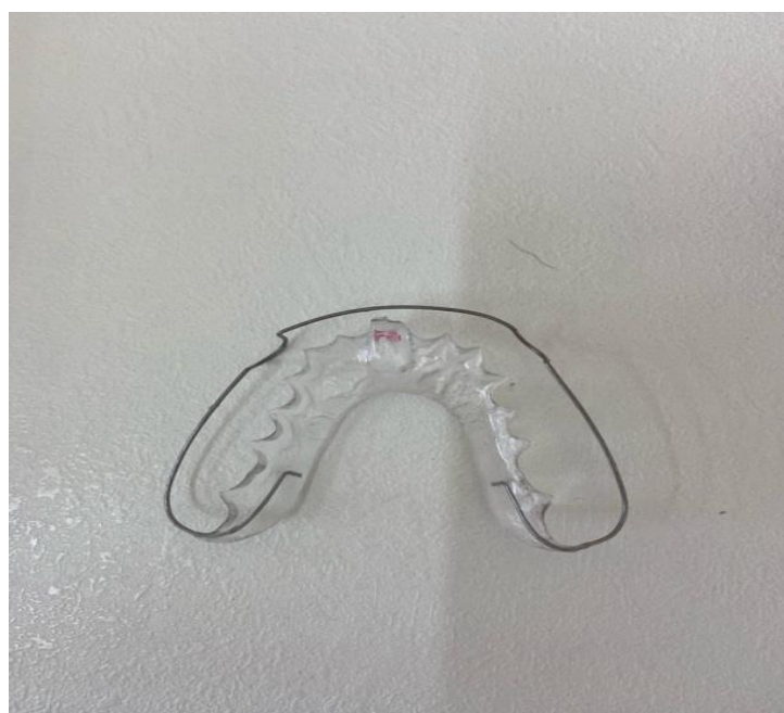
Рис. 1. Пластика с накусочной площадкой Fig. 1. A plate with a bite pad

Сформированные массивы данных проверяли на характер распределения, используя критерий Колмогорова – Смирнова. В связи с тем, что распределение выборочных данных носило нормальный характер, для выявления различий средних величин использовали критерий Стьюдента. За критический уровень значимости принимали p < 0,05 . Статистический анализ проводили, используя пакет прикладных программ Statistica 6.