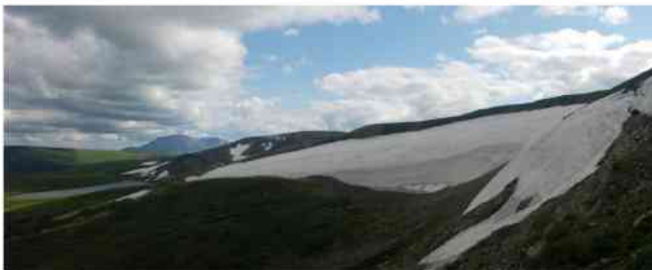
Рис. 4. Положение и размер ледника Толмачева (№ 86) 28 июля 2021 г. Fig. 4. Position and size of the Tolmachev glacier (№ 86) on 28 July 2021

Ледник Толмачева № 86 относится к морфологическому типу присклоновых. Был обследован 28 июля (рис. 4). Ледник имеет форму полумесяца, утолщенного по центру. Профиль лба выпуклый. Ниже перегиба лба отмечена крупная слоистость льда. Непосредственно к языку примыкает моренный вал несортированного обломочного материала. Высота вала от 8 м в левой до 3–4 м в правой части, ширина гребня 5–6 м, длина около 100 м. Описываемый моренный вал сравнительно молодой, на субстрате отсутствует растительный покров и лишайники. По данным Каталога ледников СССР [1980], длина ледника составляла 0,32 км, площадь 0,21 км 2 . По результатам измерений 2021 г. наибольшая длина ледника составила 736 м, наибольшая ширина 205 м, площадь 0,1 км 2 . Таким образом, ледник Толмачева увеличился в длину, при этом сократив свою площадь. В XXI в. площадь ледника варьировалась от 0,14 до 0,1 км 2 , то увеличиваясь, то уменьшаясь, в целом составляя около 65 % от площади, приведённой в [Каталог ледников СССР, 1980].