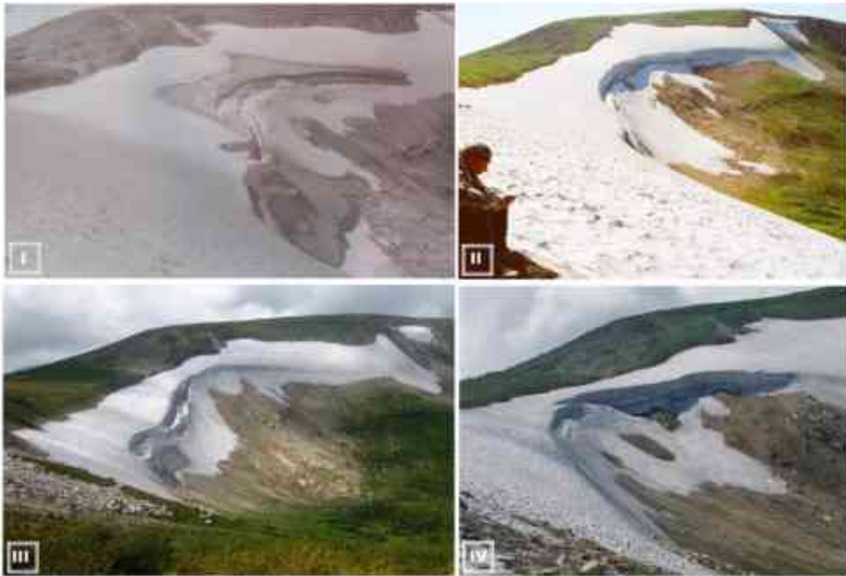
Рис. 2. Изменение ледника Черно-Июсский (№ 83) в 1973–2021 гг.

ледяного ядра, продолжает сокращаться. При этом примечательно то, что в 2021 г. наибольшей шириной обладало северо-западное фирновое поле, расположенное под участком водораздела с наибольшими абсолютными высотами.