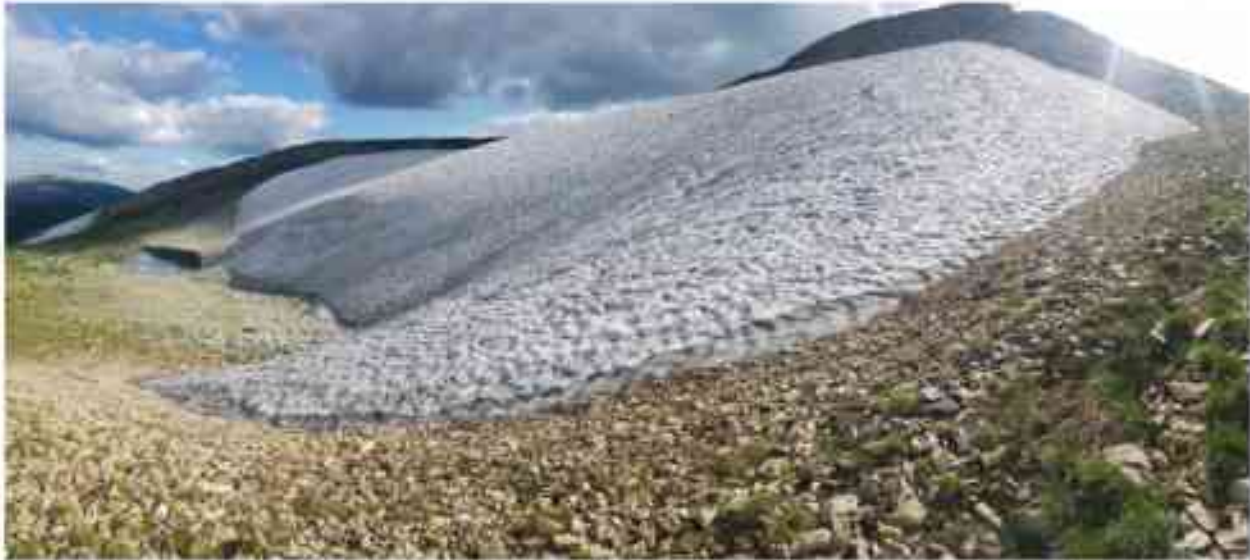
Рис. 5. Положение и размер ледника Центральный (№ 87) 28 июля 2021 г. Fig. 5. Position and size of the Central glacier (№ 87) 28 July 2021

время составляют, в среднем, около 30 % от их площади в момент каталогизации в 80-е гг. XX в. Несмотря на то, что крупные ледники Июско-Терсинской группы оледенения продолжают сокращаться, темпы отступления в 2011–2021 гг. замедлились по сравнению со второй половиной XX – первым десятилетием XXI вв.