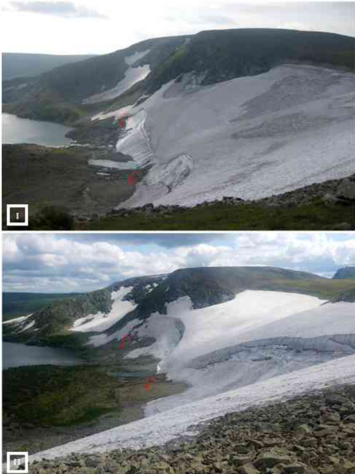
Рис. 3. Положение и размер ледника Чуракова (№ 85): I – 18 августа 2011 г.; II – 28 июля 2021 г.; a, b – легко определяемые ориентиры – скопления валунов и выступы скал Fig. 3. Position and size of the Churakov glacier (№ 85): I – 18 August 2011; II – 28 July 2021; a, b – easily identifiable landmarks – boulder clusters and rock ledges