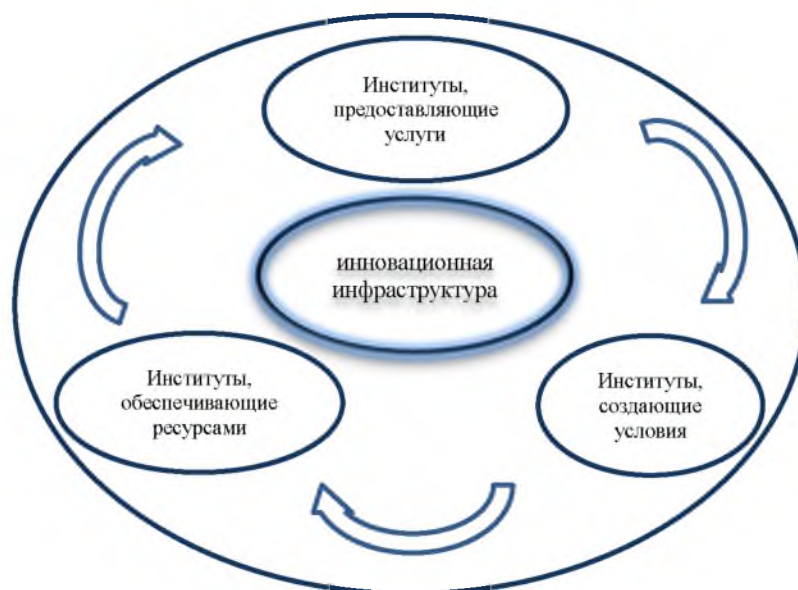
Рис. 1. Комплексный подход к определению инновационной инфраструктуры Fig. 1. An integrated approach to the definition of innovation infrastructure

В группу институтов, обеспечивающих ресурсами инновационную инфраструктуру, относят финансово-кредитные и кадровые институты. Институты, предоставляющие услуги: сбытовые и информационно-консалтинговые институты. В последнюю группу – институты, создающие условия – следует отнести правовой и производственно-технологические институты. Но центральная роль отводится именно финансовым институтам, так как они обеспечивают инновационное развитие через предоставление необходимых финансовых ресурсов, без которых не представляется возможным полноценное функционирование инновационного развития, в том числе и инновационной инфраструктуры.