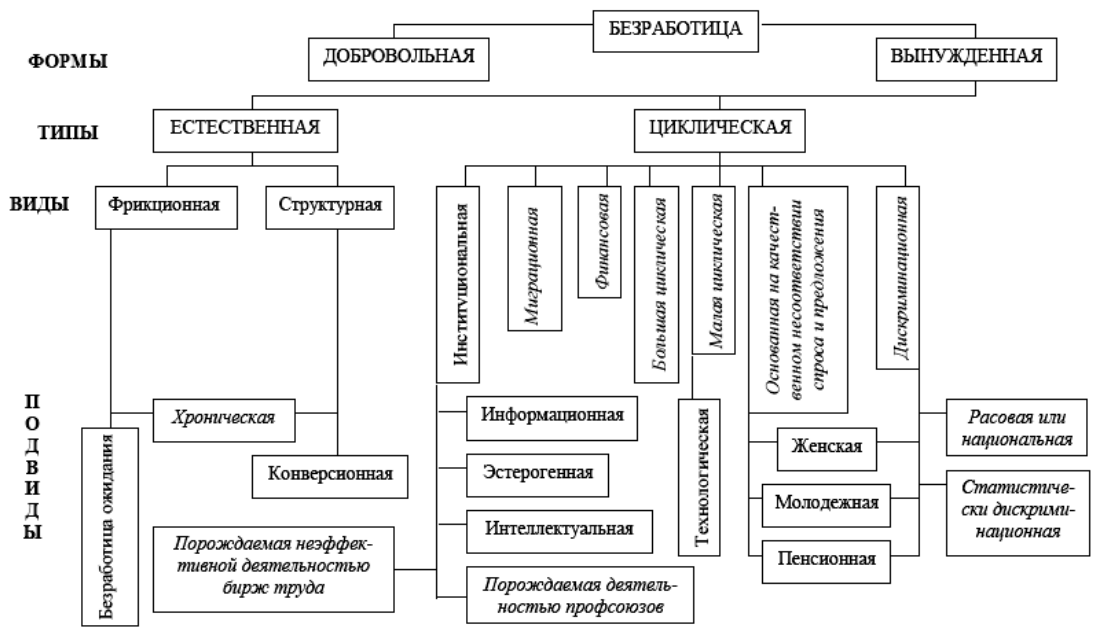
Рис. 1. Классификация безработицы по природе ее возникновения