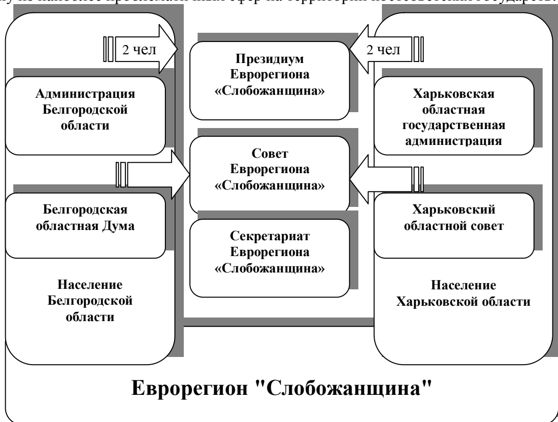
Рис. 2. Схема управления еврорегионом «Слобожанщина»

Значительный интерес в данной связи приобретает теоретическое и эмпирическое исследование практики управления городским развитием, которое представляет собой одну из наиболее проблематичных сфер на территории постсоветских государств.