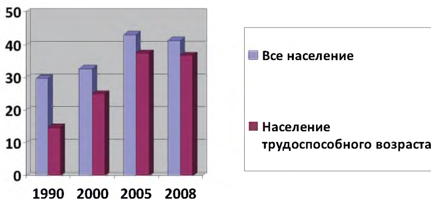
Рис. 1. Коэффициенты смертности населения от болезней органов пищеварения в Белгородской области в 1990 – 2008 гг. (число умерших на 100 тыс. человек соответствующего населения)

Удельный вес умерших от болезней органов пищеварения в трудоспособном возрасте увеличился от 3,0% в 1990 г. до 4,3% в 2000 г., до 6,1% в 2005 г., до 6,8% в 2008 г. от общего числа умерших. Соотношение коэффициентов смертности от болезней органов пищеварения и общих коэффициентов смертности населения трудоспособного возраста увеличилось от 1/1,8 в 1990 г. до 1/1,1 в 2008 г. (табл. 2, рис. 1).