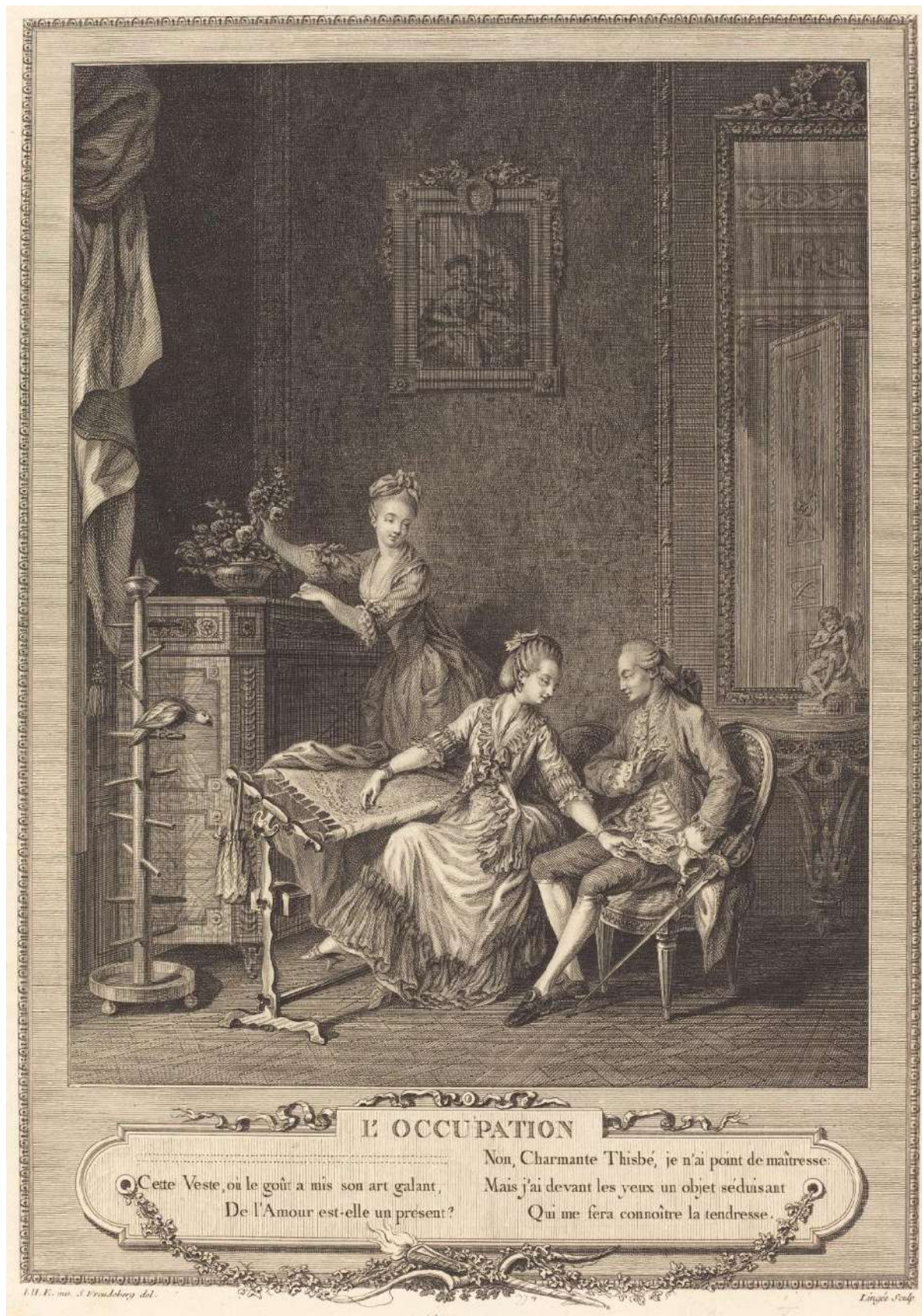
Рис. 2. Ш. Л. Линжи. По рисунку З. Фрейденбергера. Занятие. 1775 г. Fig. 2. Charles Louis Lingée inspired by Sigmund Freudenberger. "The Occupation", 1775