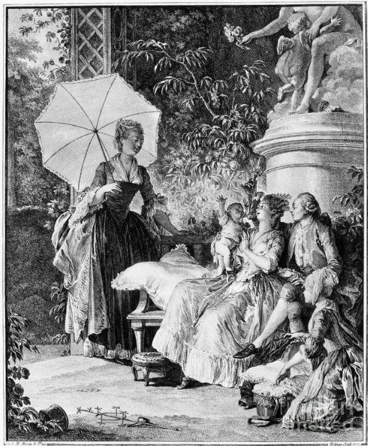
Рис. 5. Э. И. Станислас. По рисунку Ж.-М. Моро-Младшего. Радости материнства. 1777 г. Fig. 5. Isidor Stanislas inspired by Jean-Michel Moreau the Younger. “Delights of Motherhood”, 1777