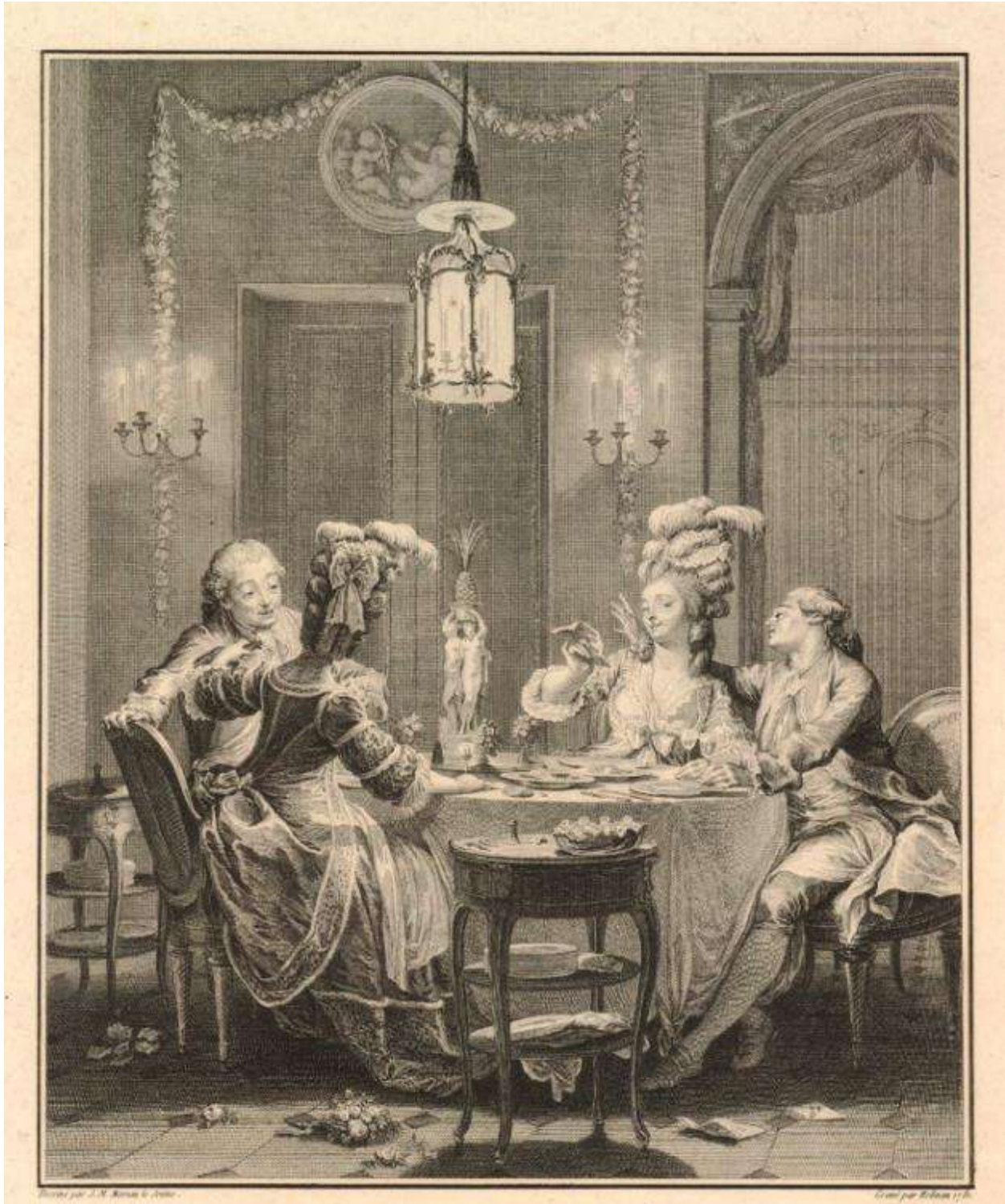
Рис. 4. Э. И. Станислас. По рисунку Ж.-М. Моро-Младшего. Изысканный ужин. 1781 г. Fig. 4. Isidor Stanislas inspired by Jean-Michel Moreau the Younger. "Elegant Dinner", 1781