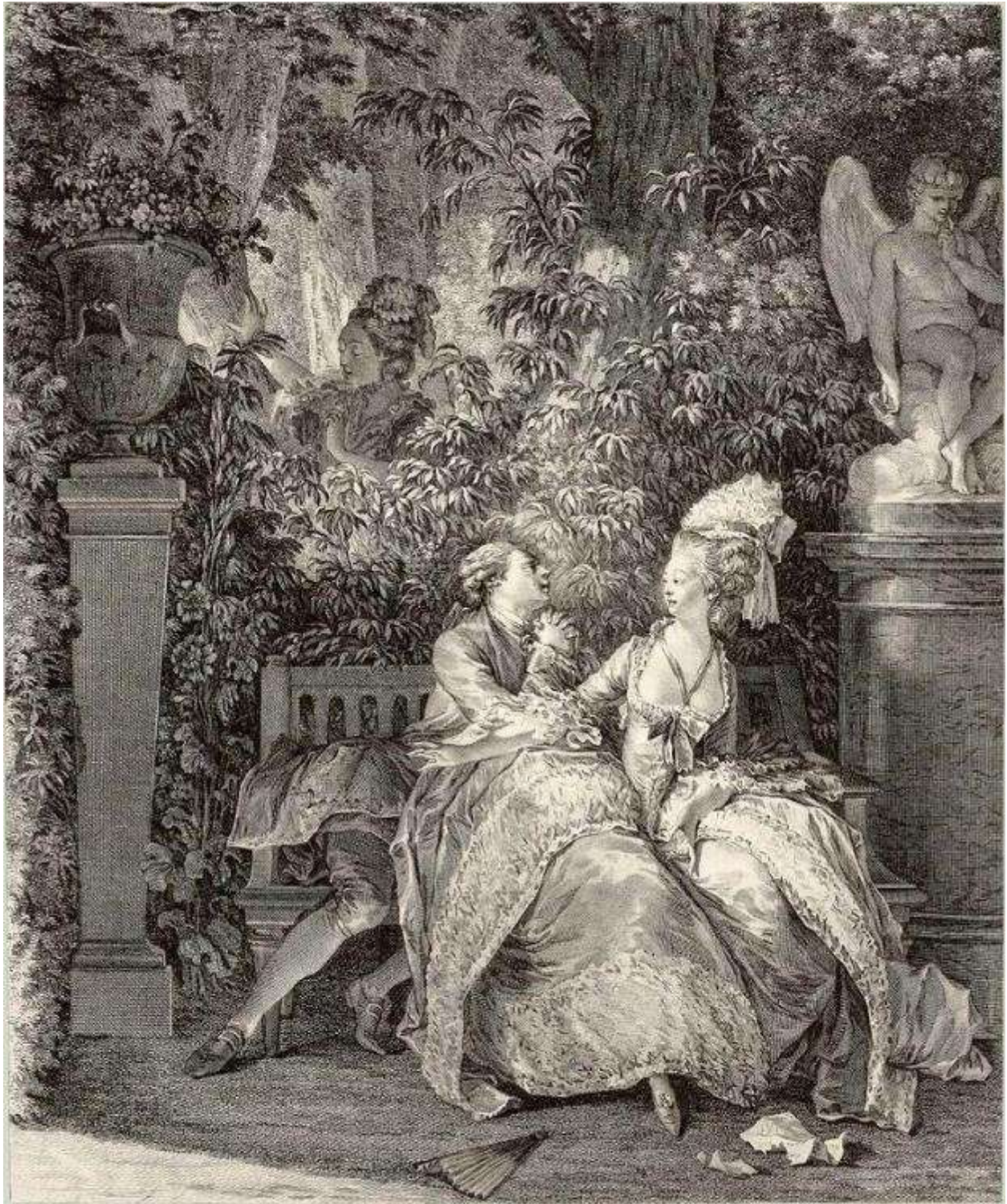
Рис. 3. Н. Тома. По рисунку Ж.-М. Моро-Младшего. Да или нет. 1781 г. Fig. 3. N. Thomas inspired by Jean-Michel Moreau the Younger. "Yes or No", 1781