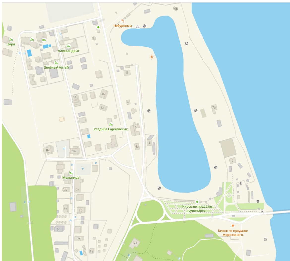
Рис. 1. Ключевой участок на территории туристского комплекса «Бирюзовая Катунь» ( https://2gis.ru/ ) Fig. 1. Key section on the territory of the tourist complex "Turquoise Katun" ( https://2gis.ru/ )

Выявление аттракторов стало основой для определения территории, на которую необходимо было сделать полетное задание для БПЛА. Съемка проходила в теплые дни без осадков, при дневной температуре +25 °С.