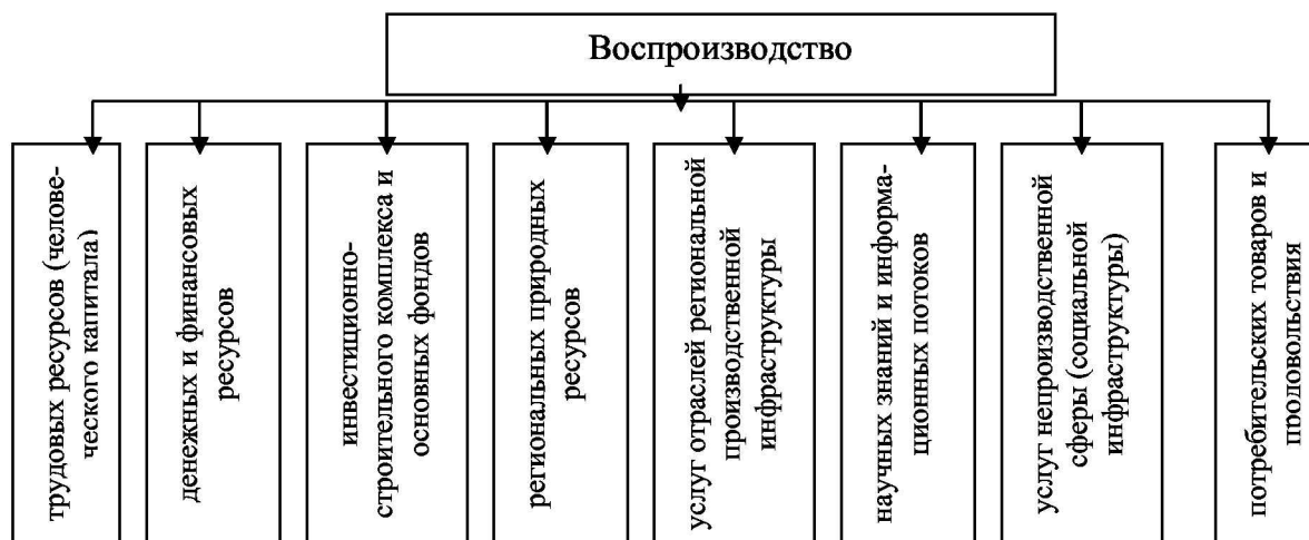
Рис. 2. Структурная схема региональных воспроизводственных циклов с высоким уровнем локализации

Нормальный ход воспроизводства предполагает бесперебойный процесс перехода (движения) стоимости из одной фазы воспроизводства в другую и повторяемость этого кругооборота. Непременным условием этого движения является завершение кругооборота промышленного капитала, возвращение к его исходной денежной форме, что предполагает соответствующий процесс реализации. Только при этих условиях обеспечивается сохранение и умножение величины основных и оборотных средств на всех уровнях хозяйствования, возможность их функционирования в новом производственном цикле с высоким уровнем локализации [5] (рис. 2).