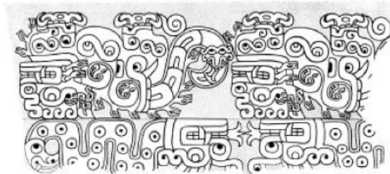
Рис. 2. Изображение кошачьего хищника на карнизе в Новом Храме, Чавин-де-Уантар 5

Также в естественном виде кошки представлены в каменных рельефах и гравировках на керамике – например, это рельеф на карнизе в юго-западной части Нового Храма в Чавин-де-Уантар (рис. 2). В этих случаях хищные кошки пышно украшены стилизованными изображениями змей, что порой даже затрудняет восприятие сюжета.