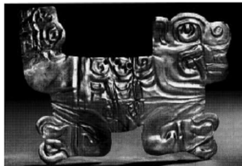
Рис. 1. Золотая пластина с изображением кошачьего хищника 400-300 гг. до н.э. Чавин 4

В естественном виде кошачьи довольно часто показываются на украшениях и в мелкой пластике, где очень детально прорисовываются все элементы (рис. 1). Как обычно, у хищников семейства кошачьих в стиле Чавин, конец хвоста сформирован как змея, или, как ее еще называют – «змея коша». Есть и другая версия (правда, более редкая) изображения хищников в Чавин – зеркальное отображение головы в профиль, украшающее заднюю часть животного. В большинстве случаев в такой двухпрофильной композиции два смежных лица в профиль присоединены к общему изображению туловища так, что они могут читаться, как два независимых силуэта. Данный тип изображения повторяется с незначительными видоизменениями, как в плоской резьбе, так и в объемной скульптуре 3 .