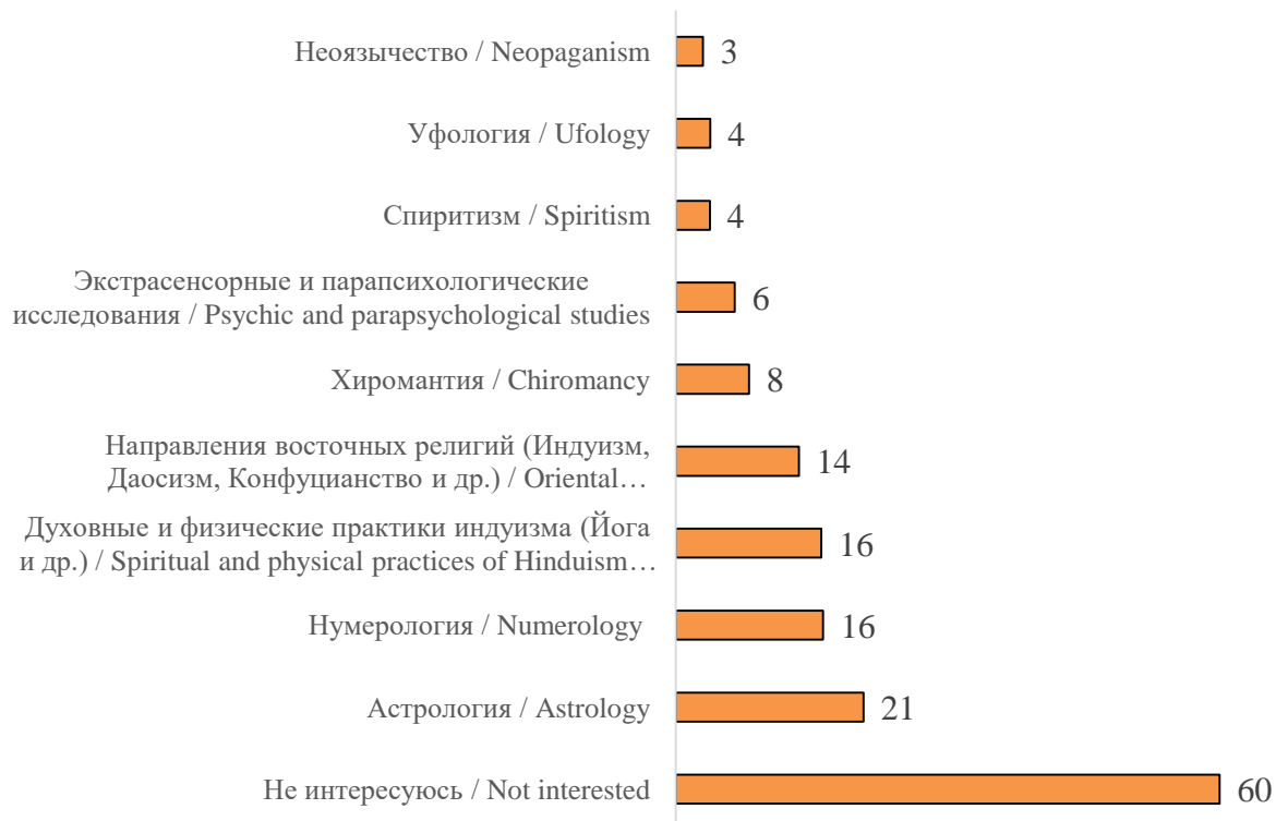
Рис. 1. Интерес студенческой молодежи к восточным, нетрадиционным религиям и эзотерическим учениям (в % от числа опрошенной молодежи (14-29 лет), Белгородская область 2022 г.) 1