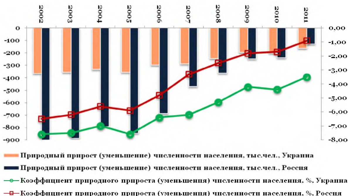
Рис. 2. Природный прирост (уменьшение) и коэффициент природного прироста (уменьшения) численности населения в Украине и России в 2002-2011 гг.

Следует отметить, что начиная с 2005 г., в то время как средний коэффициент убыли для Украины составлял 7,6, наблюдается улучшение демографической ситуации в стране. Среди регионов лидирующие позиции в повышении рождаемости занимают западные области. Несколько другая, с тенденцией снижения рождаемости, ситуация наблюдается в областях южного, центрального и северного регионов. И катастрофическое естественное уменьшение населения зафиксировано в промышленных регионах на севере страны [9].