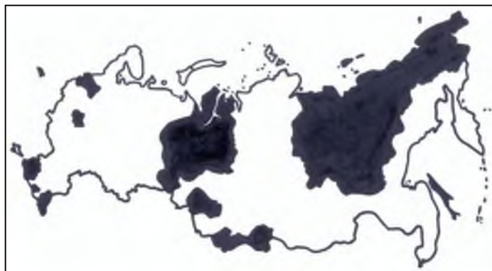
Рис. 2. Регионы первого типа на фоне остальной территории России со вторым типом многомерной траектории достижения национальных целей развития в 2021–2030 гг.

Пространственное распределение регионов по двум типам сформировало специфическую территориальную структуру (рис. 2): доминирование второго типа многомерной траектории с образованием двух непрерывных зон – западной (49 регионов) и восточной (15) – и одного анклава (Республика Крым), на фоне которых рассредоточены регионы первого типа. В дислокации 20 регионов можно выделить срединный разграничитель зон второго типа (Тюменская область с двумя автономными округами), а также столичную (г. Москва и Московская область), северо-западную (г. Санкт-Петербург, Калининградская и Ленинградская области), северо-восточную (Республика Саха (Якутия) и Чукотский автономный округ) и три южные (Краснодарский край и Республика Адыгея; Республика Дагестан и Чеченская Республика; Республика Алтай и Республика Тыва) группы регионов. В несколько упрощенном (одномерном) виде это примерно соответствует вкраплению регионов с растущей численностью населения (первый тип) в большинство регионов с уменьшающейся людностью (второй тип).