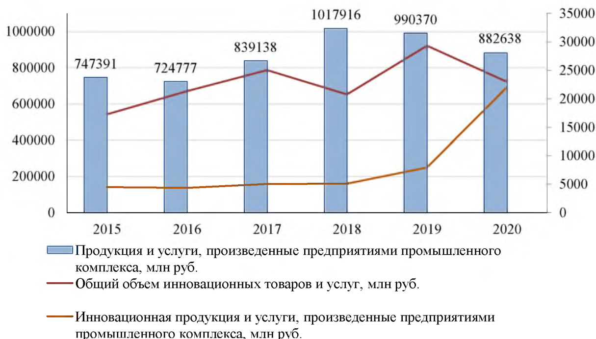
Рис. 2. Производство продукции, работ и услуг предприятиями производственного комплекса Волгоградской области, млн руб. Fig. 2. Production of products, works and services by enterprises of the production complex of the Volgograd region, million rubles

Анализ данных (рис. 2) показал, что предприятия промышленного комплекса Волгоградской области снизили объем производства продукции и выполнение услуг с 1017916 млн руб. в 2018 году до 882638 млн руб. в 2020, что свидетельствует о негативных изменениях в экономике региона. Вместе с тем, динамика произведенной инновационной продукции и оказанных услуг предприятиями промышленного комплекса демонстрирует динамичный рост инновационной активности, увеличение которой происходило даже в условиях ухудшения рыночной конъюнктуры. Если объем инновационной продукции и услуг в 2015 году составлял 4484 тыс. руб., то уже в 2019 показатель повысился до 7923 млн руб., а в 2020 достиг значения 22066 млн руб.