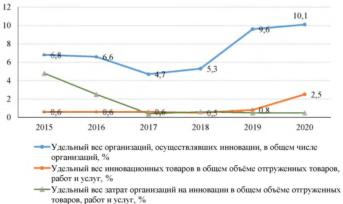
Рис. 4. Показатели инновационного развития промышленного комплекса Волгоградской области