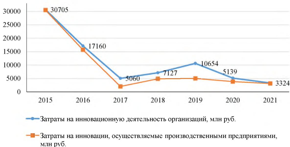
Рис. 1. Затраты на технологические инновации организаций Волгоградской области, млн руб.

Показатель затрат промышленных предприятий на инновации, измеряемый как удельный вес в общем объеме отгруженных товаров, работ и услуг, составил 0,5% в 2020 году против 4,8% в 2015. Снижение значения данного критерия оценки отмечается за весь анализируемый период, начиная с 2016 года. Структура затрат на инновации производственных предприятиями сформировалась в связи с воздействием ряда факторов: наличие ресурсов организаций, мероприятия по государственной поддержке, специфические технологические особенности.